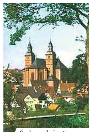
Šv. Jurgio bažnyčia