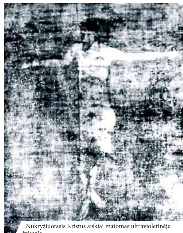
Nukryžiuotasis Kristus aiškiai matomas ultravioletinėje šviesoje