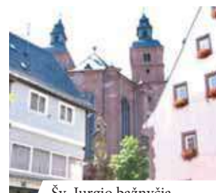
Šv. Jurgio bažnyčia