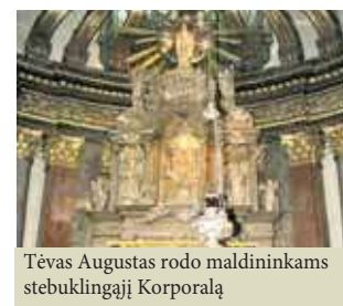
Tėvas Augustas rodo maldininkams stebuklingąjį Korporalą