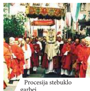
Procesija stebuklo garbei