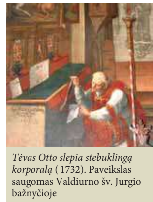
Tėvas Otto slepia stebuklingą korporalą (1732). Paveikslas saugomas Valdiurno šv. Jurgio bažnyčioje