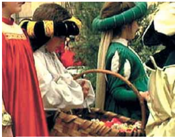
Procesija Brangiojo Kraujo garbei Mantujoje