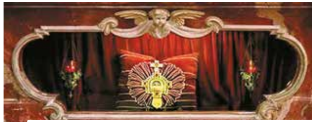
Brangiausiojo Kristaus Kraujo relikvijorius

Daugiau nei 900 metų Vaingarteno benediktinų vienuolyne galima pagerbti Brangiausiojo Kristaus Kraujo relikviją. Daugelio istorikų nuomone romėnų legionierius Lionginas ją atgabeno į Mantują. Vėliau Švenčiausiojo Kraujo relikvija buvo padalyta, ir jos porcijas valdovai gaudavo dovanų. Tarp jų buvo Karolis Didysis ir įvairūs popiežiai.