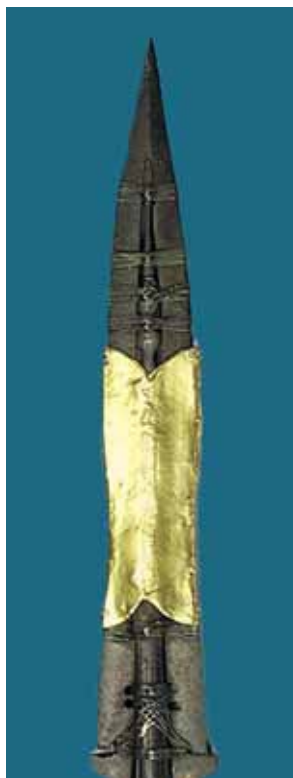
Šventosios ieties, kuria romėnų kareivis perdūrė Nukryžiuotojo Jėzaus šoną, relikvija Vienos Meno istorijos muziejuje