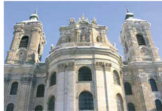
Vaingarteno šv. Martyno bažnyčia, kurioje saugoma Švenčiausiojo Kraujo relikvija