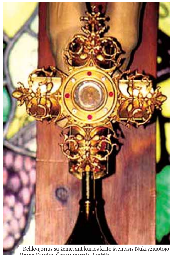
Relikvijorius su žeme, ant kurios krito šventasis Nukryžiuotojo Jėzaus Kraujas, Čenstachovoje, Lenkija