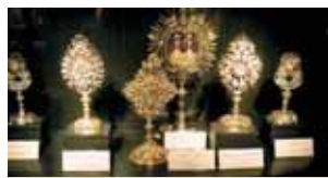
Monstrancijos su Kristaus kančios relikvijomis Vienos Meno istorijos muziejuje