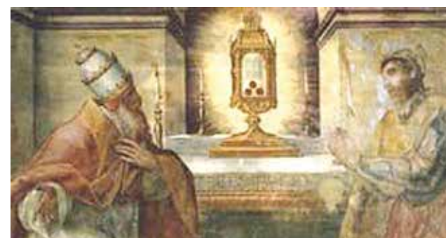
Popiežius Pijus II pagarbina brangiąją relikviją

penktadienį po Kristaus žengimo į dangų iškilmės Vaingartene vyksta Blutritt – „Kraujo jojimas“ relikvijai pagerbti. Šiame didžiuliam parade dalyvauja beveik 3000 raitelių – įvairių parapijų tikintieji ir dvasininkai. Relikviją gabena Heilig-Blut-Reiter (Šventasis Kraujo raitelis), kuris ją laimina namus, kiemus ir laukus.