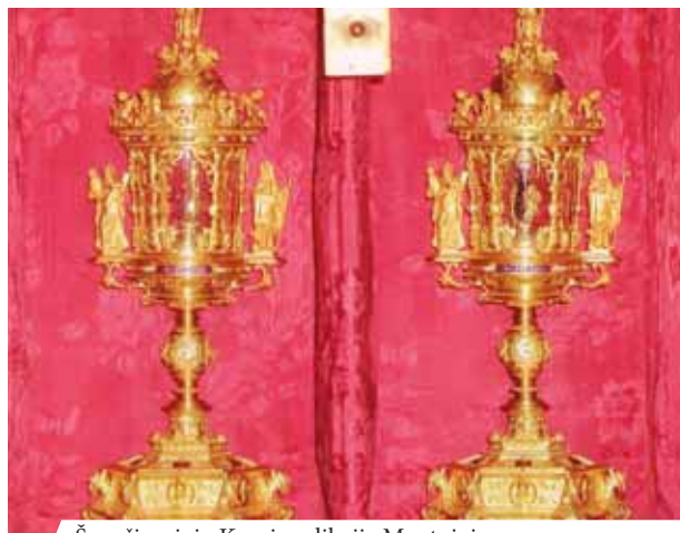
Švenčiausiojo Kraujo relikvija Mantujoje