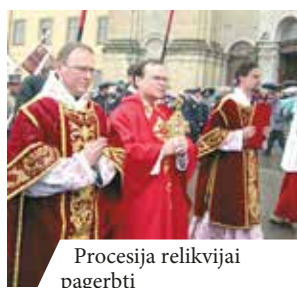
Procesija relikvijai pagerbti