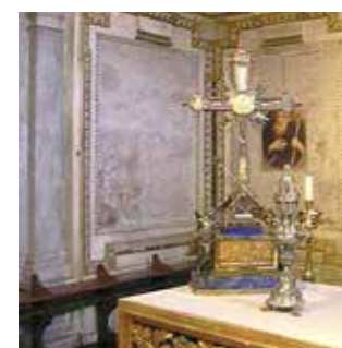
Kristaus kryžiaus atplaiša: relikvija, saugoma Romoje Šv. Jeruzalės Kryžiaus bazilikoje