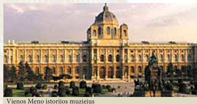
Vienos Meno istorijos muziejus