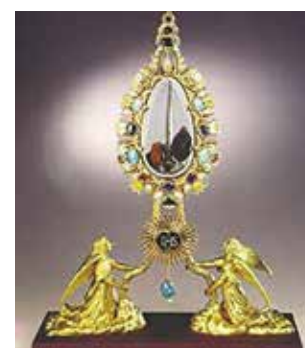
Kryžiaus vinies relikvija Hofburge, Viena