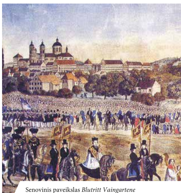
Senovinis paveikslas Blutritt Vaingartene