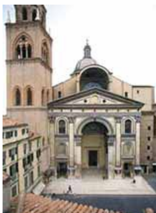
Mantujos šv. Andriejaus bazilika, kurioje saugoma Brangiausiojo Kristaus Kraujo relikvija