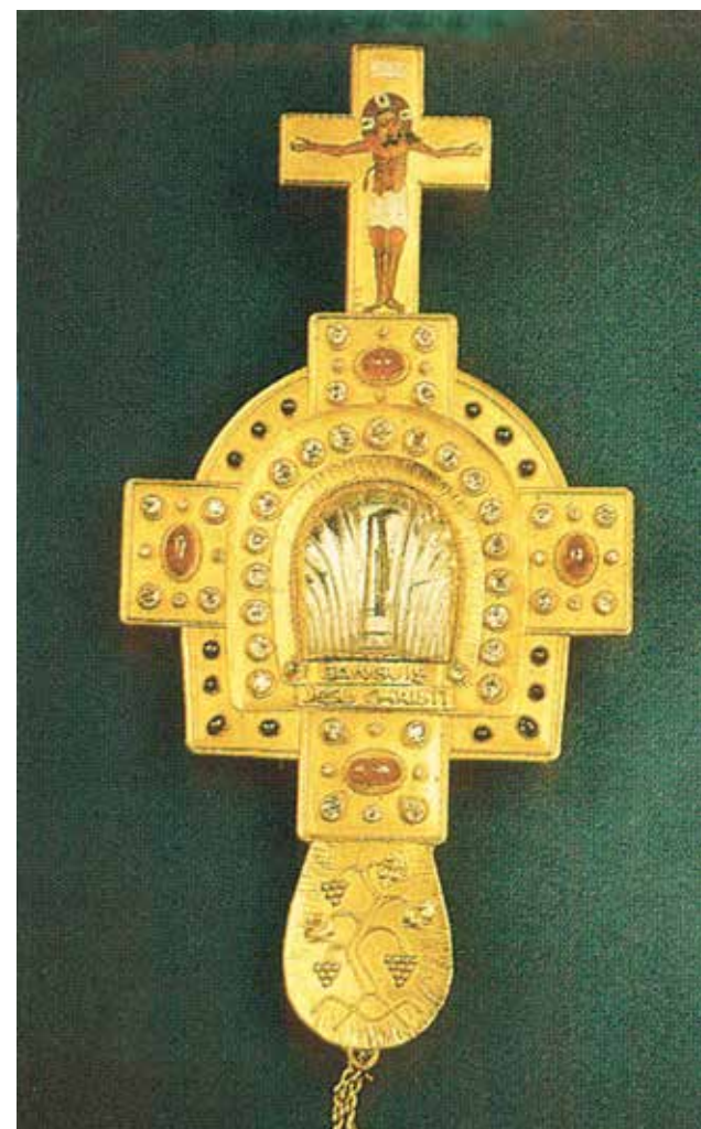
Brangiausiojo Kristaus Kraujo relikvija