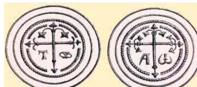
Stebuklingosios Ostijos atspaudai.