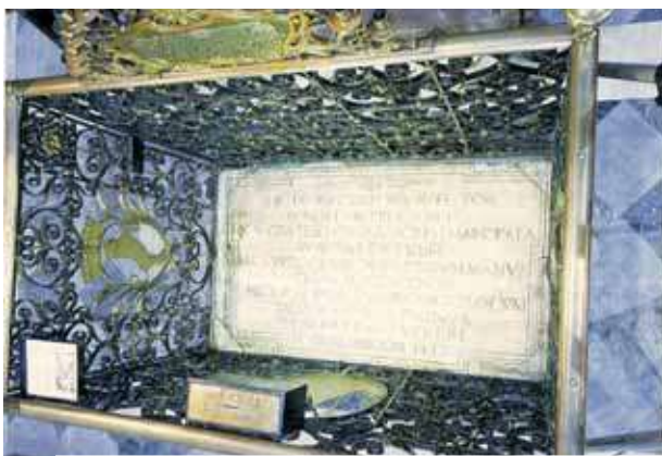
Atminimo lenta, žyminti vietą, kur parkrito mulė