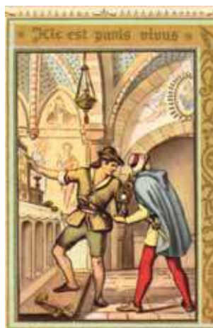
Turino stebuklo atvaizdai