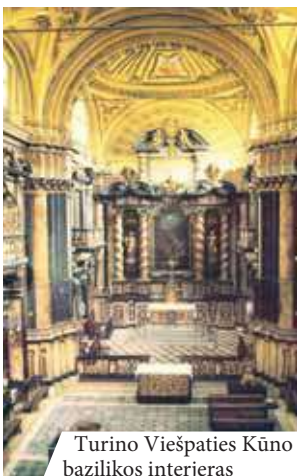
Turino Viešpaties Kūno bazilikos interjeras