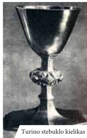
Turino stebuklo kielikas