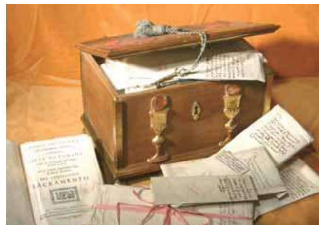
Turino savivaldybės 1672 metais padaryta kipariso medžio dėžutė stebuklo dokumentams saugoti

per non obbligare Dio a fare eterno miracolo col mantenere sempre incorrotte, come si mantennero, quelle stesse eucaristiche specie