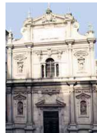
Turino Viešpaties Kūno bazilika