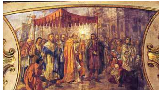
Luigi Vacca (1778–1854) freskos ant bazilikos skliauto (1853), iliustruojančios stebuklo epizodus