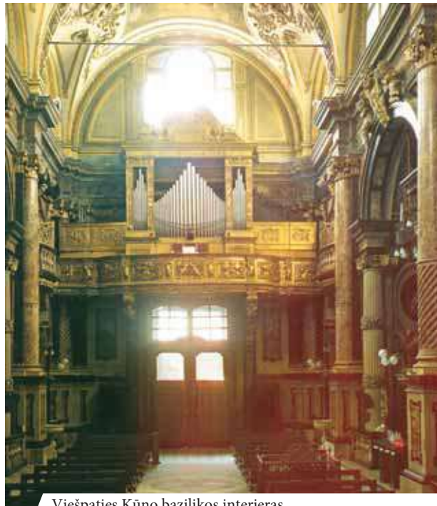
Viešpaties Kūno bazilikos interjeras

Turino Viešpaties Kūno bazilikoje geležinėmis grotelėmis užtvirtuota vieta, kur 1453 metais įvyko pirmasis Eucharistijos stebuklas. Įrašas grindyse už grotelių skelbia: „Čia kniūbsčia parpuolė mulė, kuri nešė Dievo Kūną; čia Šventoji Ostija, išsilaisvinusi iš maišo, kur buvo įdėta, aukštyn pakilo; čia ji maloningai nusileido į maldaujančias turiniečių rankas. Šią vietą stebuklas padarė šventą. Prisimink, atsiklaupęs pagarbink ir melsk, kad būtum įkvėptas Viešpaties baimės (1453 m. birželio 6 d.).“