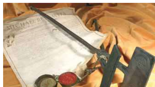
Geležinis liejinys, kuriuo buvo padaryti stebuklingosios Ostijos atspaudai, 1673 metais buvo perkeltas iš Eksilių į Turiną, 1684 metais padovanotas savivaldybei ir iki šiol saugomas miesto istorijos archyvuose

Nežinomas autorius, Švenčiausiojo Sakramento stebuklas . Raižinys. Triptikas vaizduoja šias stebuklo fazes: Ostijos vagystė Eksiliuose, mulės kritimas ir Ostijos skrydis aukštyn, nusileidimas į kieliką. Virš šoninių arkų iškilę miesto herbai. Pirmą kartą išspausdinta Giulio Cezare Bergera, L'Anno Secolare: Festa Solennemente Celebrata dalla Illustrissima Città di Torino Agli Sei Di Giugno dell'Anno 1653 Che Fù l'Anno Dugentesimo Dope Il Famoso Miracolo del Santissimo Sacramento (Simeomo kolekcija, C 2412)