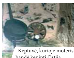
Keptuvė, kurioje moteris bandė kepti Ostiją