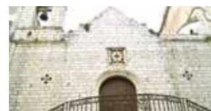
Šv. Andriejaus bažnyčia, iš kurios šventvagė paėmė konsekruotą Ostiją