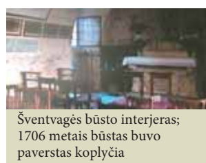
Šventvagės būsto interjeras; 1706 metais būstas buvo paverstas koplyčia