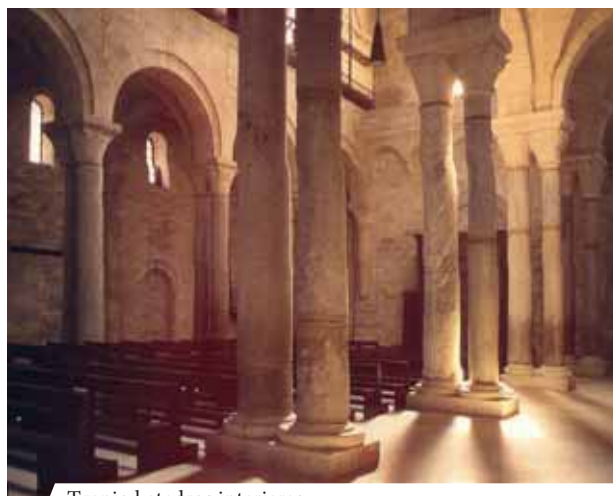
Tranio katedros interjeras