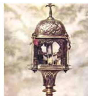
XVII a. relikvijorius su stebuklingąja Ostija