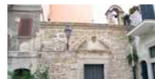
Namai, kur įvyko stebuklas, paversti koplyčia