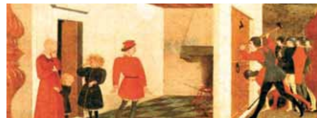
Paolo Uccello (1397–1475), Išniekintos Ostijos stebuklas (1467–1469). Detalė. Urbino Nacionalinė galerija