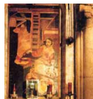
Koplyčia šv. Andriejaus bažnyčioje, dedikuota stebuklui, kur saugoma brangioji relikvija