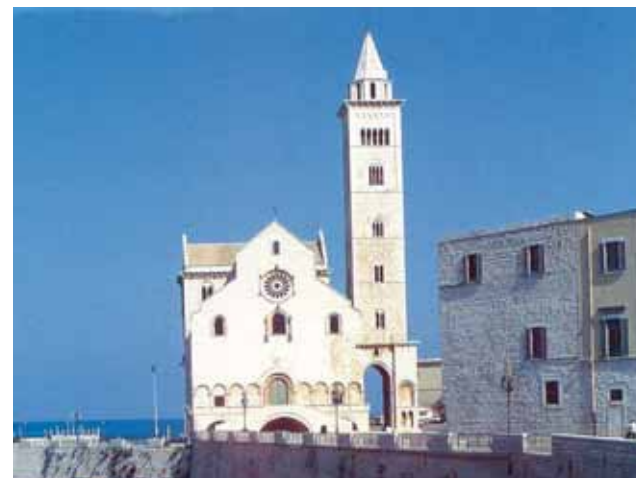
Švč. M. Marjos Ėmimo į dangų katedra Tranyje, kur daug metų buvo saugomos stebuklo relikvijos