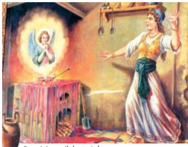
Senovinis paveikslas atvaizdas

Viena nekrikščionė moteris netikėjo realiu Kristaus buvimu Eucharistijoje. Draugės krikščionės padedama ji per šv. Mišias pavogė konsekruotą Ostiją. Moteris metė iššūkį Dievui: konsekruotą Ostiją įdėjo į keptuvę su aliejumi. Staiga iš Ostijos pasipylė Kraujas, užliejo grindis ir ištekėjo pro duris laukan.