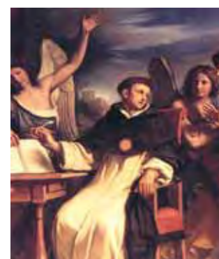
Giovanni Francesco Barbieri (Guercino). „Šventasis Tomas Akvinietis rašo, angelų padedamas“ (1662 m.)