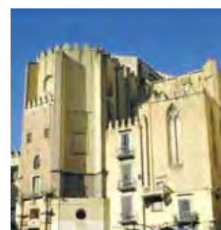
Šv. Dominyko bažnyčia Neapolyje, Italijoje

D irbdamas profesoriumi Paryžiuje, šventasis Tomas atsidūrė tarp Sorbonos universiteto profesorių, besiginčijančių dėl Eucharistijos sakramento. Nesutarimas vyko dėl dviejų dalykų: a) jei juslės jaučia vadinamojo „akcidenso“ buvimą, pavyzdžiui, spalvą, skonį, kietumą ir kiekį, tai būtų konkreti tikros ir realios eucharistinės duonos bei vyno tąsa; b) tikėjimas patvirtina, kad sakramente egzistuoja Kristaus Kūnas ir Kraujas, o tai akivaizdžiai prieštarauja pirmajai teorijai. Vieni Paryžiaus teologai vadovavosi objektyvia teorija, kiti - tikėjimo tiesomis. Jie nusprendė atsiklausti šventojo Tomo, kuris garsėjo filosofine inteligencija ir teologiniu šventumu. Šie vyrai paprašė šventojo išsakyti savo nuomonę, kad jo teologinė išmintis taptų taisykle, kuria reikėtų vadovautis. Tada Tomas, kaip paprastai darydavo, susitelkė į maldą ir