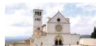
Šv. Pranciškaus viršutinė bazilika, Asyžius