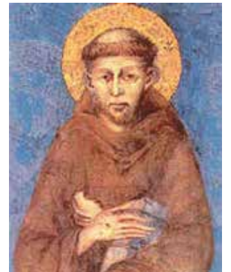
Šv. Pranciškus Asyžietis, Cimabue