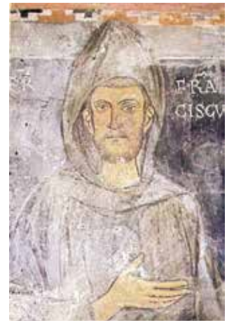
Šventojo Pranciškaus portretas, Speco