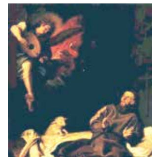
Šventasis Pranciškus, Pranciškaus Ribaltos Prado muziejus, Madridas