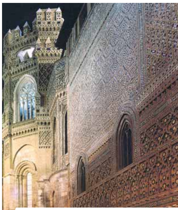
Sosto katedros išorinė pusė