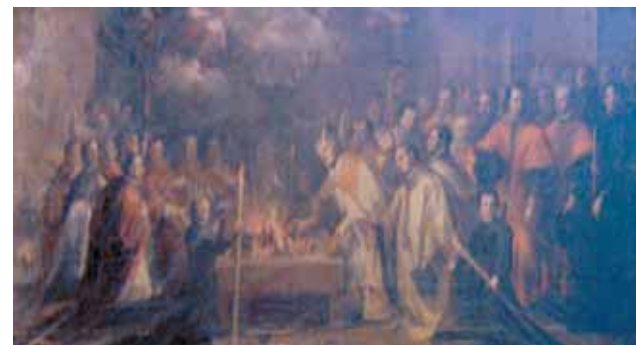
Sosto katedroje esantis senovinis paveikslas, vaizduojantis stebuklą Šv. Mažojo Dominyko Valiečio koplyčioje. Ant sienos, esančios priešais koplyčią, taip pat yra marmurinė plokštė, kurioje aprašomas stebuklas.