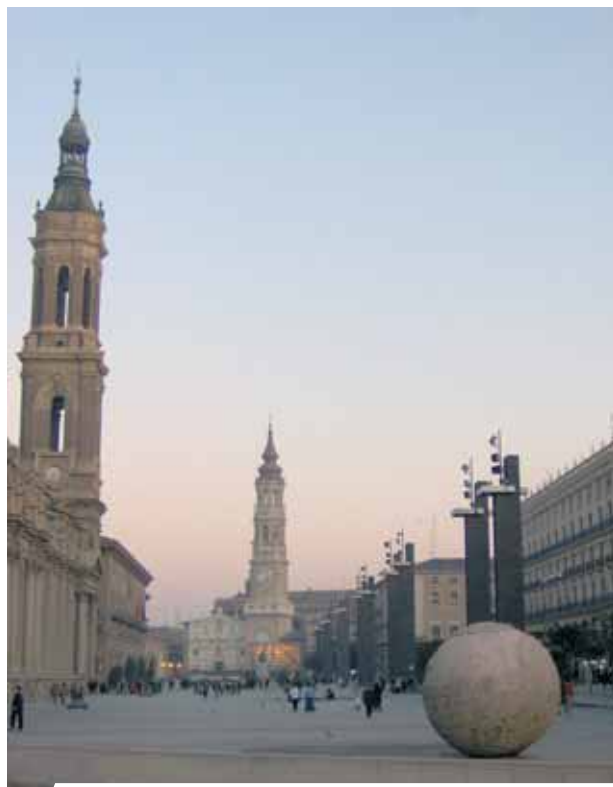
Sosto katedra, Saragosa

Konsekruotoje Ostijoje, kurią pavogė viena Saragosos moteris, norėdama iš jos pasigaminti meilės eliksyrą, pasirodė Kūdikėlis Jėzus. Saragosos miesto rotušės archyvuose saugomas dokumentas, kuriame išsamiai aprašomas šis stebuklas. Šalia Šv. Mažojo Dominyko Valiečio (San Dominguito del Val) koplyčios esančioje katedroje yra paveikslas, kuriame tiksliai pavaizduotas nuostabus įvykis.