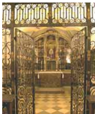
Koplyčia Andechse, kurioje yra šventovė