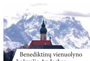
Benediktinų vienuolyno bažnyčia Andechse

Tarp svarbiausių veikalų, kuriuose minimas šis 595 metais Romoje įvykęs eucharistinis stebuklas, yra 787 m. diakono Pauliaus parašytas Vita Beati Gregorii Papae (Palaimino popiežiaus Grigaliaus gyvenimas).