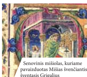
Senovinis mišiolas, kuriame pavaizduotas Mišias švenčiantis šventasis Grigalius