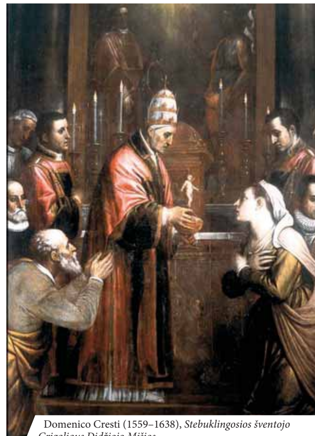
Domenico Cresti (1559-1638), Stebuklingosios šventojo Grigaliaus Didžiojo Mišios