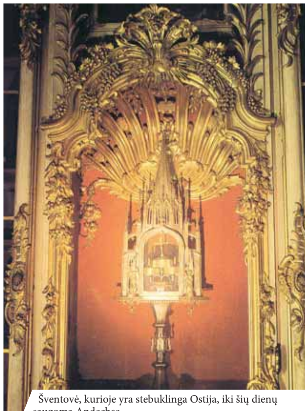
Šventovė, kurioje yra stebuklinga Ostija, iki šių dienų saugoma Andechse

Šis eucharistinis stebuklas, kurio relikvija iki šiol saugoma Andechso benediktinų vienuolyne, Vokietijoje, yra patvirtintas daugybe rašytinių šaltinių. Stebuklas įvyko Romoje 595 m. per Eucharistijos šventimą, kuriam vadovavo popiežius šventasis Grigalius Didysis. Tuo metu žmonėms priimant šventąją Komuniją, viena Romos didikė ėmė juoktis, nes abejojo realiu Kristaus buvimu konsekruotoje duonoje ir vyne. Popiežius, sutrikęs dėl jos netikėjimo, nusprendė neduoti jai Komunijos, ir tada duona virto Kūnu ir Krauju.