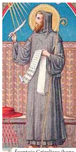
Šventojo Grigaliaus ikona