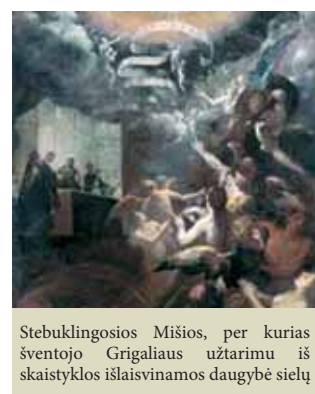
Stebuklingosios Mišios, per kurias šventojo Grigaliaus užtarimu iš skaistyklos išlaisvinamos daugybė sielų