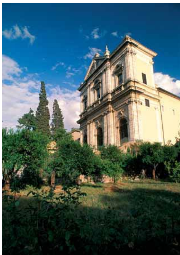
Romos Šventojo Grigaliaus Didžiojo bažnyčia