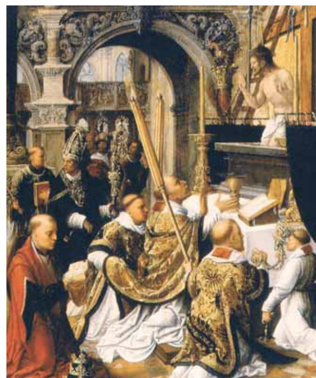
Adrianas Ysenbrandt'as, XVI a. Jėzaus apsiereikimas su kančios ženklais per šventojo Grigaliaus aukotas šv. Mišias

Iki šių dienų dalis šio stebuklo relikvijos saugoma Andechse, Vokietijoje, prie vietos benediktinų vienuolyno.