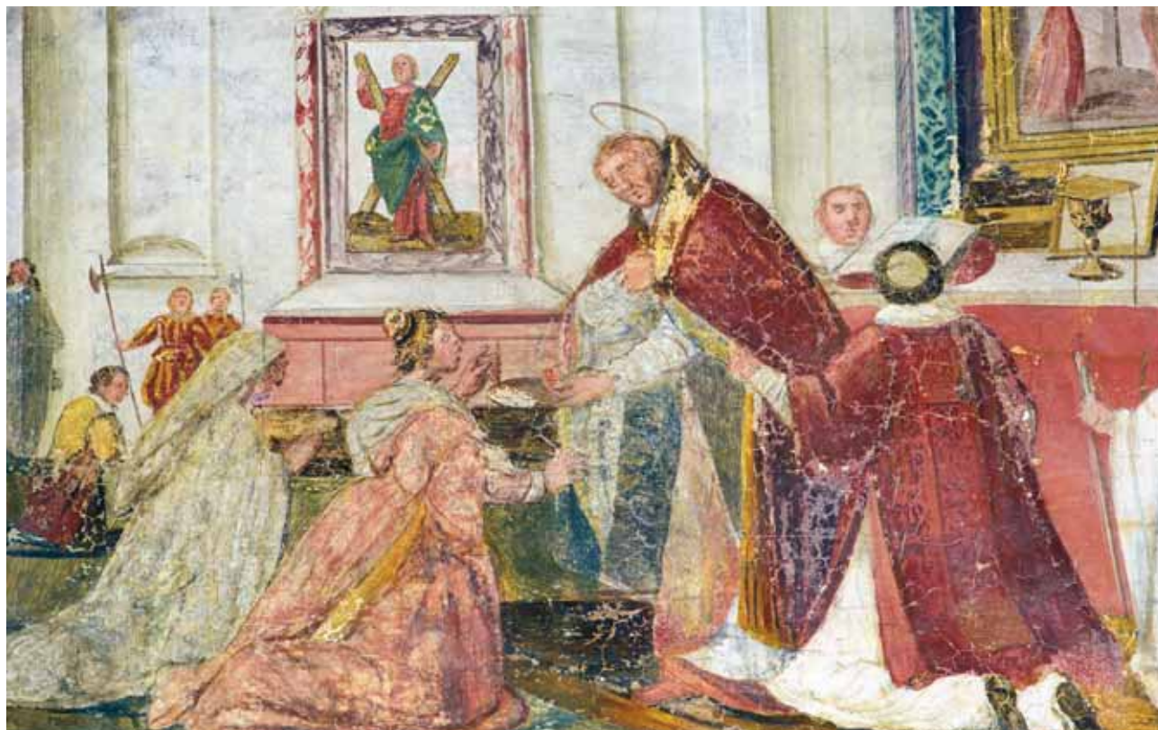
Nicolo Circignani (Pornarancio), Eucharistinis Grigaliaus Didžiojo stebuklas. Romos Šventojo Grigaliaus Didžiojo bažnyčios portiko liUNETė

Vos baiges melstis, jis pamatė, kad dalis moters paruoštos duonos tapo kūnu ir krauju. Moteris atgailavo, atsiklaupė ant žemės ir ėmė verkti.