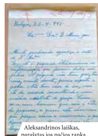
Aleksandrinės laiškas, parašytas jos pačios ranka

Jos prašymu ant kapo užrašyti žodžiai: „Nusidėjėiai, jei mano kūno dulkės gali būti naudingos jūsų išgelbėjimui, prisiartinkite prie jų, vaikščiokite ant jų ir trypkite jas, kol jos išnyks. Bet daugiau nenusidėkite, daugiau nebeįžeidinkite mūsų Jėzaus. Nerizikuokite prarasti Jėzaus visai amžinybei! Juk Jis toks geras... Mylėkite Jį!“