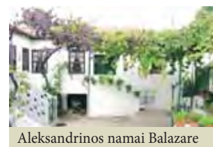
Aleksandrinės namai Balazare