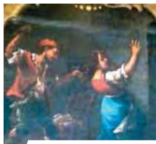
Freskose atvaizduotas stebuklas