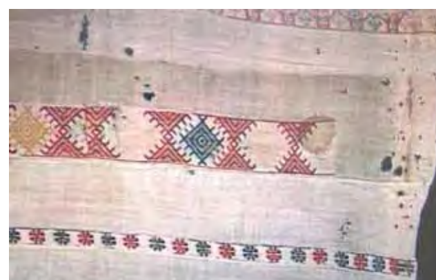
Sukruintos lininės staltiesės fragmentas