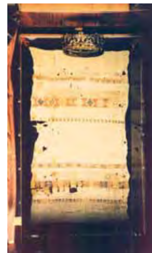
Sukruintos lininės staltiesės, į kurią Ričiatela suvyniojo Ostiją, relikvija