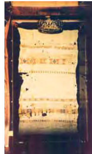
Sukruintos lininės staltiesės, į kurią Ričiatela suvyniojo Ostiją, relikvija