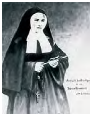
Šventoji Bernadeta apsisprendė atsiduoti religiniam gyvenimui ir įstojo į Gailėstingųjų seserų vienuolyną Neverse