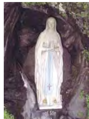
Mergelės Marijos statula grotėje, kur ji pasirodė šventajai Bernadetai