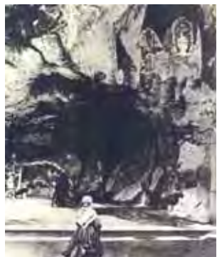
Viena seniausių šventosios Bernadetos nuotraukų prie grotos 1864 m.