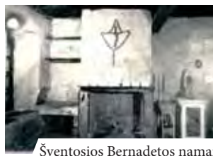
Šventosios Bernadetos namai