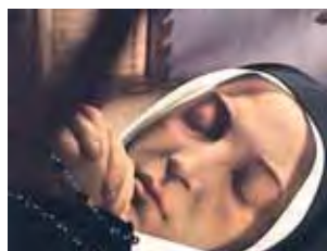
Nekaltasis šventosios Bernadetos kūnas Neverso Gailėstingųjų seserų motinos namuose