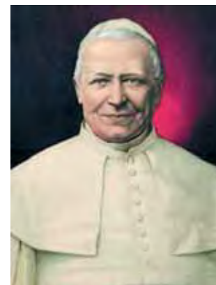
Pijus IX 1854 m. dokumentu "Ineffabilis Deus" paskelbė Nekaltojo Prasidėjimo dogmą