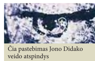
Čia pastebimas Jono Didako veido atspindys

Vieną 1531 m. gruodžio 9 d. rytą indėnas Jonas Didakas (Juan Diego) ėjo pro Tepejako kalvą Meksiko miesto šiauriniame pakraštyje, link Tlateloko į katekizmo pamoką. Staiga jis išgirdo švelnią giesmę ir pasuko ten, iš kur sklido šis garsas. Jis priėjo jauną moterį, šviečiančia suknele, kuri pasakė esanti Mergelė Marija. Ji maldavo Joną paprašyti Meksiko vyskupo, kad jis įrengtų mažą šventovę jos apsireiškimo vietoje, kur visi galėtų ateiti pagarbinti Jos Sūnaus. Jonas Didakas pakluso, tačiau vyskupas Juan de Zumárraga juo netikėjo ir sakė paprašyti Marijos ženklą. Kuomet Mergelė Marija apsireiškė Jonui Didakui trečią kartą, ji pažadėjo duoti jam ženklą sekančią dieną. Visgi pirmadienį jis neatėjo į sutartą vietą, nes jo dėdė sunkiai susirgo ir jam reikėjo ligonių patepimo.