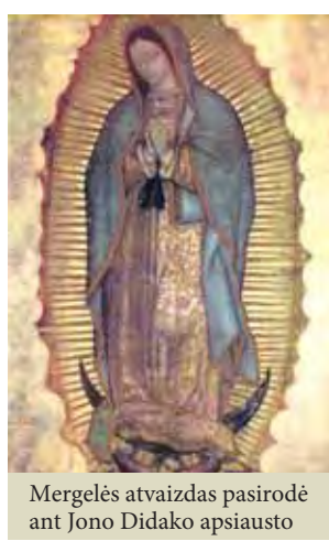
Mergelės atvaizdas pasirodė ant Jono Didako apsiaušto