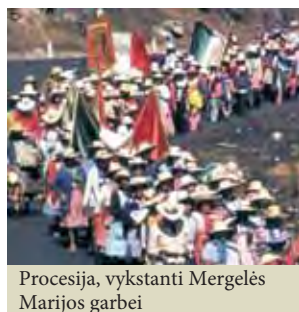
Procesija, vykstanti Mergelės Marijos garbei