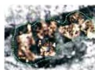
Padidinti atvaizdai, esantys Mergelės akyse