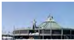
Naujoji Gvadalupeš šventovė

Nenuginčijamas Eucharistijos istorinis pagrindas yra Dievo Sūnaus Įsikūnijimas. „Kristaus Kūnas yra Marijos Kūnas“, - sako šv. Augustinas. „Marijoje, kaip tobulame paveiksle, Bažnyčia džiaugsmingai mato tai, kuo trokšta ir tikisi būti pati“ (Sacrosanctum Concilium, 103): tabernakuliu, motinos iščiomis, monstrancija - indu, kuriame garbinamas eucharistinis Kristus. Gvadalupeje Dievo Motina pasirodė apsirengusi suknele, kuri per liemenį buvo sujuosta juodu diržu. Suknelė buvo identiška toms, kurias nėštumo metu dėvėjo vietinės moterys.