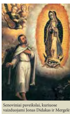
Senoviniai paveikslai, kuriuose vaizduojami Jonas Didakas ir Mergelė