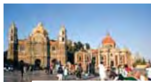
Senoji Gvadalupeš bazilika