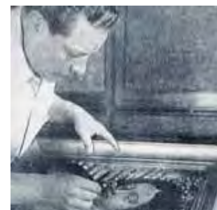
Chosė Karlosas Salinas ir mokslininkas Chosė Aste Tonsmanas išanalizavo ir aptiko Gvadalupeš Mergelės akių rainelėse per apsiausto atskleidimą vyskupui dalyvavusių žmonių atvaizdus