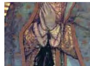
Diržas reiškia Mergelės nėštumą. Jis yra virš bambos. Diržo forma nahuatlių pasaulyje reiškia ciklo pabaigą ir naujos eros gimimą. Gvadalupeš Mergelės atvaizde ji simbolizuoja, kad su Jėzumi Kristumi prasidės nauja era tiek senajam, tiek naujajam pasauliui.