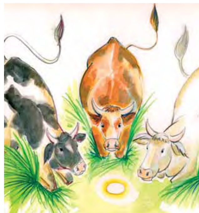
Paveikslas, vaizduojantis stebuklą

S eniausiuose dokumentuose aprašyta, kaip įvyko stebukas. Jaučiai traukė plūgą, už kurio vadeliojo ūkininkas. Saulė leidosi prie horizonto mesdama ilgus šešėlius. Artojas ragino gyvulius, kurie lėtai mynė į kalną. Staiga plūgas užstrigo. Jaučiai traukė dar stipriau ir šone išvertė didelį žemės grumstą.