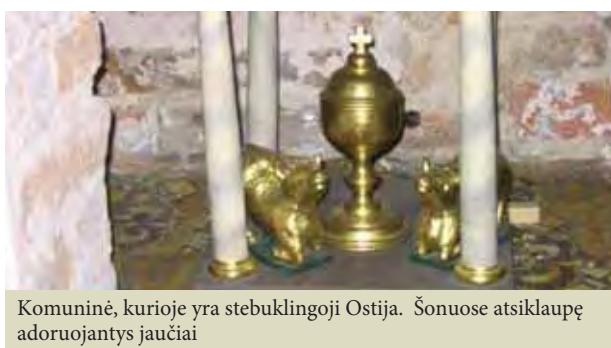
Komuninė, kurioje yra stebuklingoji Ostija. Šonuose atsiklaupę adoruojantys jaučiai