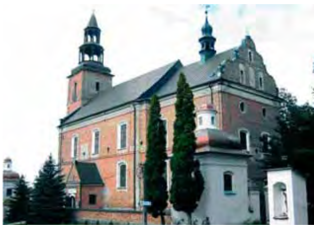
Glotovo eucharistinė šventovė