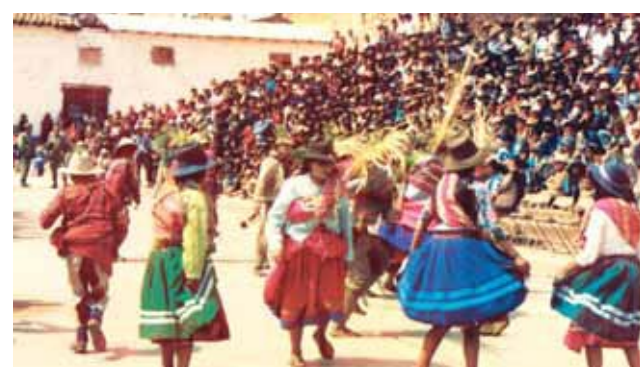
Dieviškojo Kūdikio pagerbimo iškilmės