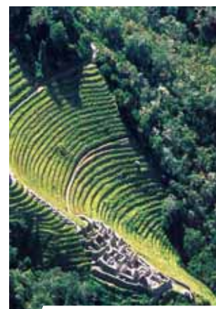
Senovinės terasos, Peru