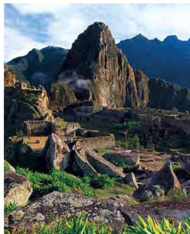
Maču Pikču (inkų miestas)