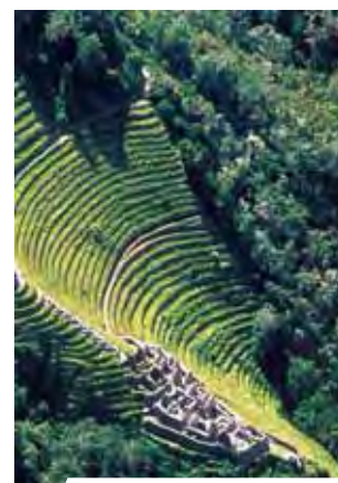
Senovinės terasos, Peru