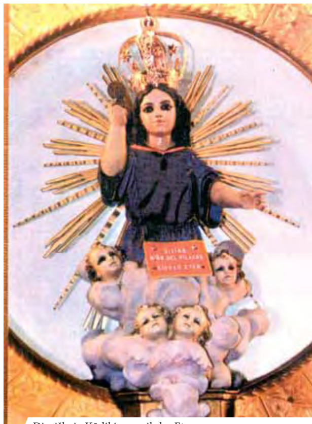
Dieviškojo Kūdikio paveikslas Etene

Eucharistinis stebuklas Peru mieste Port Etene įvyko maždaug prieš 365 metus. Viešai adoracijai išstatytoje Ostijoje pasirodė Kūdikėlis Jėzus ir trys tarpusavyje sujungtos skaisčiai baltos spalvos širdys. Šio įvykio garbei kasmet švenčiama šventė prasideda liepos 12 d., perkeliant stebuklingą Ostiją iš jos šventovės į Eteno miesto bažnyčią, ir baigiasi liepos 24 d.