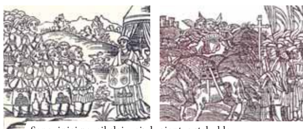
Senoviniai paveikslai, vaizduojantys stebuklą