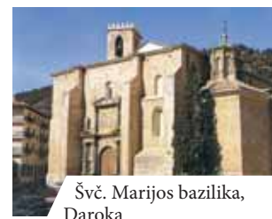
Švč. Marijos bazilika, Daroka