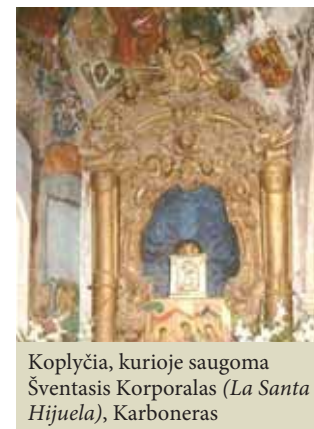
Koplyčia, kurioje saugoma Šventasis Korporalas (La Santa Hijuela), Karboneras