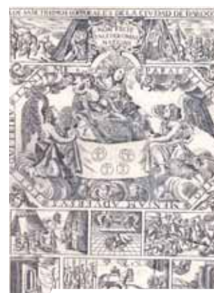
Senovinės stebuklo reprodukcijos iš XVI a.