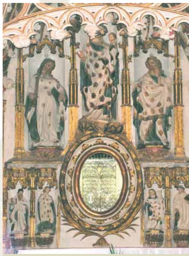
Korporalų (Los Corporales) koplyčia