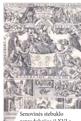
Senovinės stebuklo reprodukcijos iš XVI a.