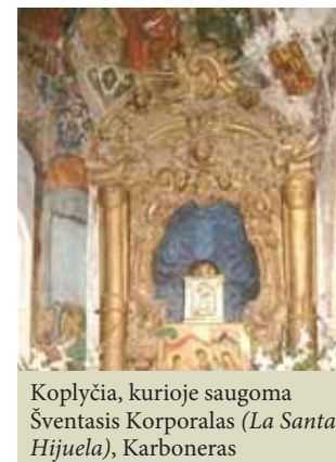
Koplyčia, kurioje saugoma Šventasis Korporalas (La Santa Hijuela), Karboneras