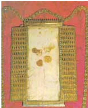
Darokos bažnyčioje saugomo kruvino korporalo relikvija

Eucharistinis Darokos stebuklas buvo patvirtintas prieš pat vieną iš daugelio ispanų mūšių su maurais. Krikščionių vadai paprašė lauke esančio kunigo aukoti šv. Mišias, tačiau praėjus kelioms minutėms po konsekracijos, prieš puolimą priverstė kunigą nutraukti religines apeigas ir, suvyniojus į korporalą, paslėpti konsekruotas Ostijas. Ispanai mūšį laimėjo ir vadai paprašė kunigo, kad galėtų priimti anksčiau konsekruotas Ostijas. Tačiau Jos buvo rastos visiškai permirkusios Krauju. Dar ir šiandien galima pagerbti tuos Krauju paženklintus audinius.