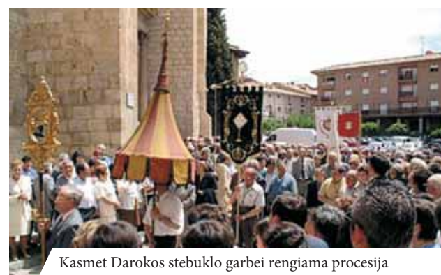
Kasmet Darokos stebuklo garbei rengiama procesija