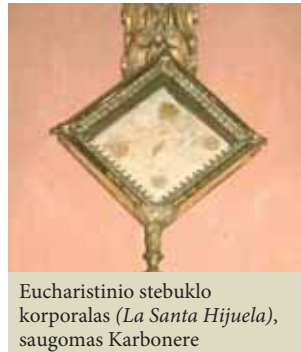
Eucharistinio stebuklo korporalas (La Santa Hijuela), saugomas Karbonere