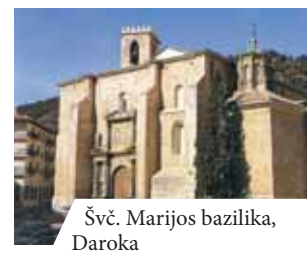
Švč. Marijos bazilika, Daroka