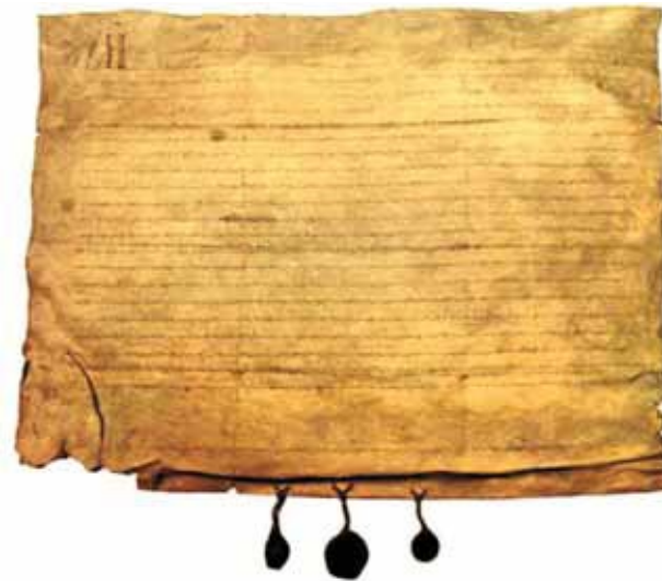
Kolegijos bažnyčioje saugomas Carta de Chiva dokumentas, kuriame aprašomas stebuklas