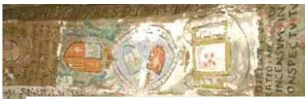
Sventasis Korporalas (La Santa Hijuela), koplyčios freska, Karboneras