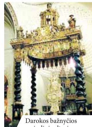
Darokos bažnyčios pagrindinis altorius