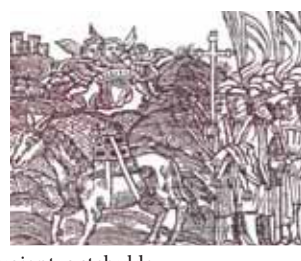
Senoviniai paveikslai, vaizduojantys stebuklą