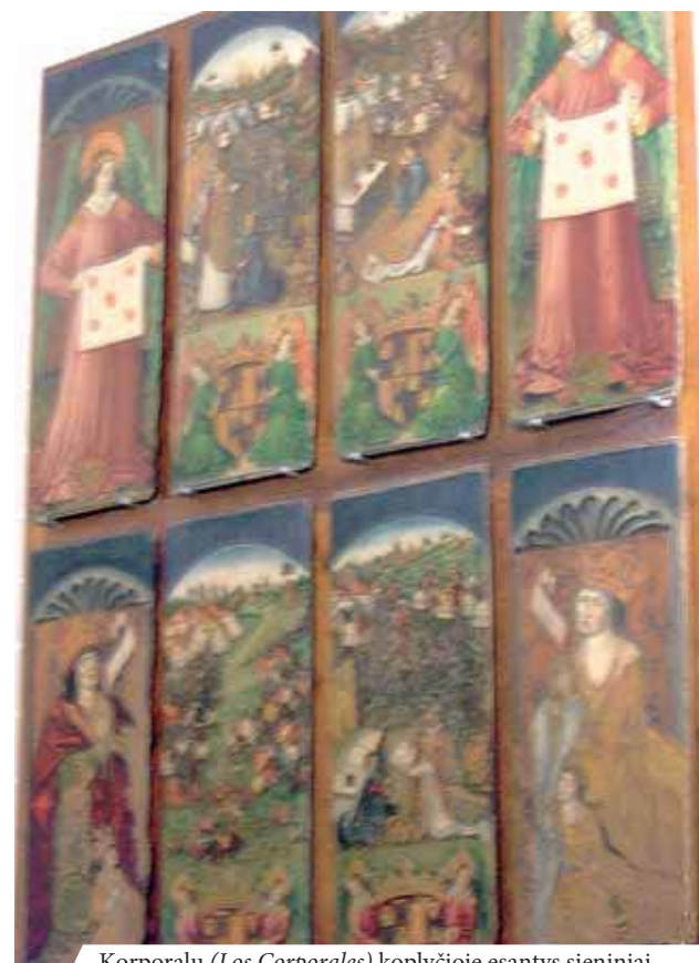
Korporalų (Los Corporales) koplyčioje esantys sieniniai paveikslai, kuriuose aprašomas stebuklas