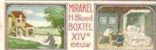
Eucharistinis stebuklas, įvykęs šv. Petro bažnyčioje Bokstelyje