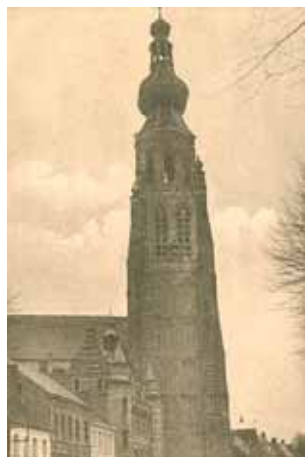
Hokstrateno šv. Kotrynos bažnyčios eksterjeras