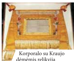
Korporalo su Kraujo dėmėmis relikvija