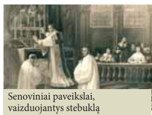
Senoviniai paveiksliai, vaizduojantys stebuklą