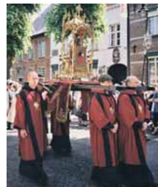
Relikvija, nešama procesijoje