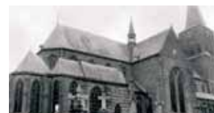
Bokstelio šv. Petro bažnyčia, kurioje įvyko Eucharistijos stebuklas