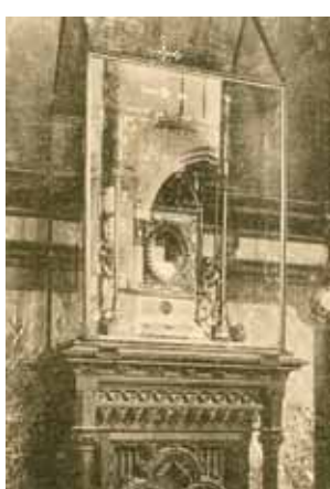
Skelbiama gavus Mertenso instituto leidimą