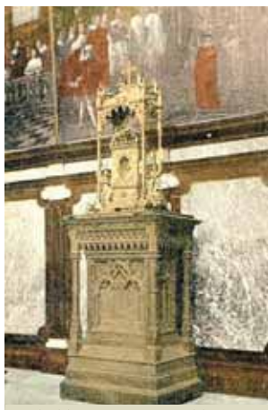
Stebuklingo Kraujo relikvija šv. Kotrynos bažnyčioje