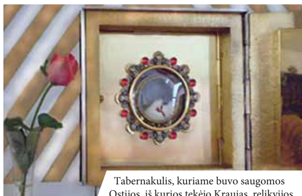
Tabernakulis, kuriame buvo saugomos Ostijos, iš kurios tekėjo Kraujas, relikvijos