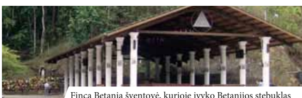
Finca Betania šventovė, kurioje įvyko Betanijos stebuklas