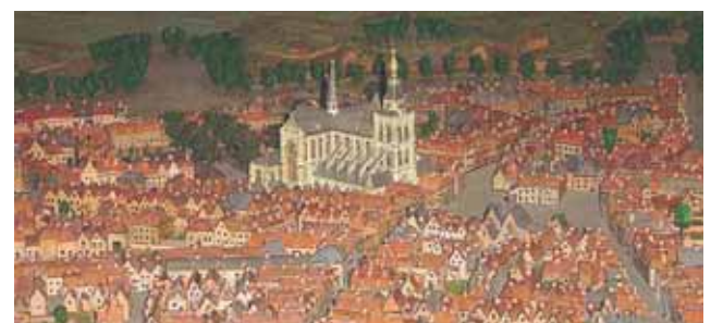
Berchano miesto maketas tuo laikotarpiu, kai įvyko stebuklas

ilgus metus jis buvo uždraustas, katalikai tylomis saugojo stebuklo atminimą. XX a. pamaldumas buvo atgaivintas ir visuomenės iniciatyva organizuota daug renginių stebuklui atminti.