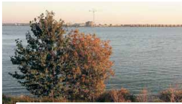
Šeldos upės vaizdas