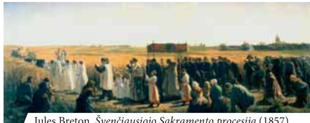
Jules Breton, Švenčiausiojo Sakramento procesija (1857)

Bergen op Zoom miestas yra žinomas ne tik dėl daugybės kanalų, bet ir dėl Eucharistijos stebuklo, įvykusio 1421 metais. Šv. Petro ir Pauliaus bažnyčios klebonas ne vieną mėnesį abejojo realiu Kristaus Kūno ir Kraujo buvimu Eucharistijoje. Jis nerodė jokios pagarbos Švenčiausiajam Sakramentui. Vieną dieną po šv. Mišių jis paėmė likusias konsekruotas Ostijas ir išmetė jas į upę. Po kelių mėnesių Ostijas rado plūduriuojančias ant vandens, jos buvo permirkusios Krauju.