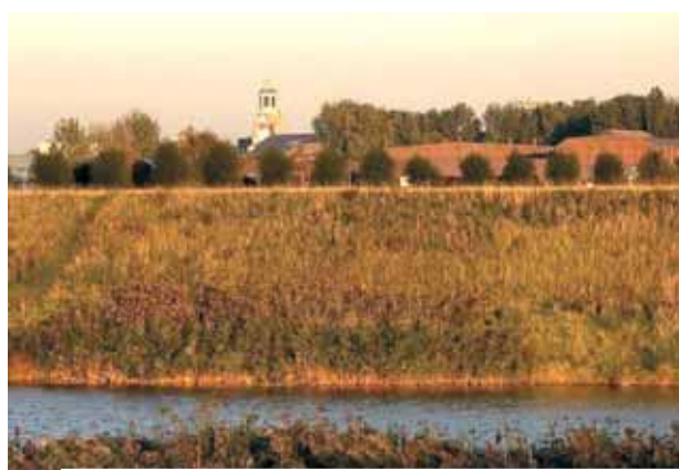
Šv. Petro ir Pauliaus bažnyčia ir Šeldos upė