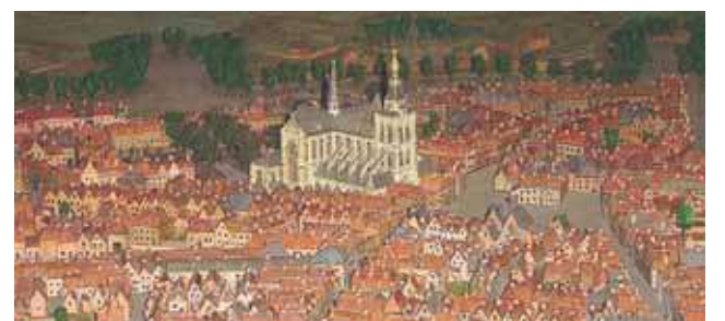
Berchano miesto maketas tuo laikotarpiu, kai įvyko stebuklas

ilgus metus jis buvo uždraustas, katalikai tylomis saugojo stebuklo atminimą. XX a. pamaldumas buvo atgaivintas ir visuomenės iniciatyva organizuota daug renginių stebuklui atminti.