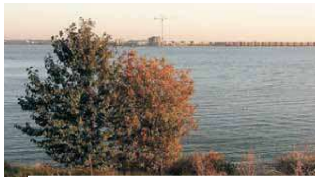
Šeldos upės vaizdas