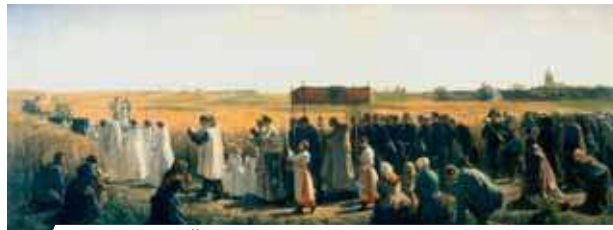
Jules Breton, Švenčiausiojo Sakramento procesija (1857)

Bergen op Zoom miestas yra žinomas ne tik dėl daugybės kanalų, bet ir dėl Eucharistijos stebuklo, įvykusio 1421 metais. Šv. Petro ir Pauliaus bažnyčios klebonas ne vieną mėnesį abejojo realiu Kristaus Kūno ir Kraujo buvimu Eucharistijoje. Jis nerodė jokios pagarbos Švenčiausiajam Sakramentui. Vieną dieną po šv. Mišių jis paėmė likusias konsekruotas Ostijas ir išmetė jas į upę. Po kelių mėnesių Ostijas rado plūduriuojančias ant vandens, jos buvo permirkusios Krauju.