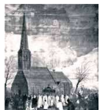
Paveikslas, vaizduojantis procesiją stebuklui pagerbti, esantis Mertenso institute