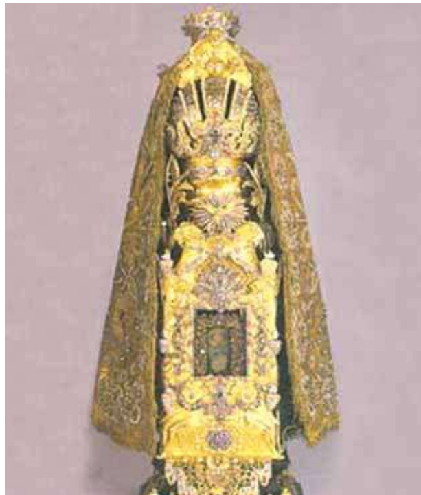
Relikvijorius su Wunderbarlichen Gutes – stebuklingąja Ostija

Augsburge įvykusį Eucharistijos stebuklą vietiniai vadina Wunderbarlichen Gutes – Stebuklinguoju gėriu. Jis aprašytas knygose ir dokumentuose, kuriuos galima rasti valstybinėje viešojoje Augsburgo bibliotekoje. Pavogta Ostija pavirto kraujuojančiu Kūnu. Šventoji dalelė ne kartą buvo tirta, ir mokslininkai visada patvirtindavo, kad ten yra žmogaus Kūnas ir Kraujas. Šiandien relikvija saugoma Šventojo Kryžiaus vienuolyne, kuriuo rūpinasi tėvai dominikonai.