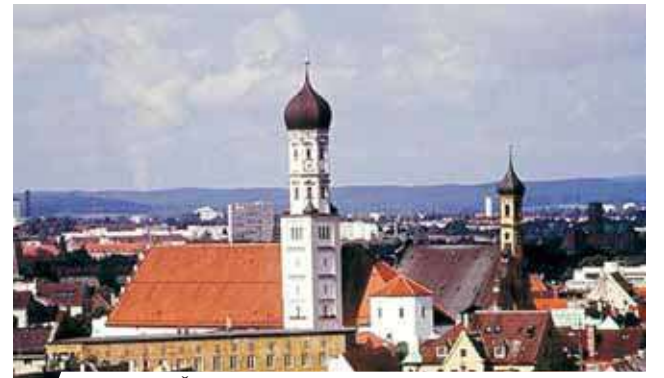
Augsburgo Šventojo Kryžiaus vienuolynas