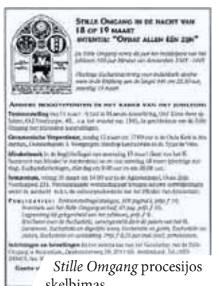
Stille Omgang procesijos skelbimas