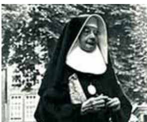
Beginių ordino vienuolė