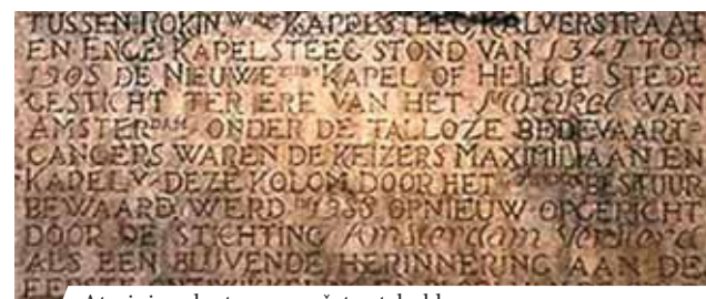
Atminimo lenta su aprašytu stebuklu