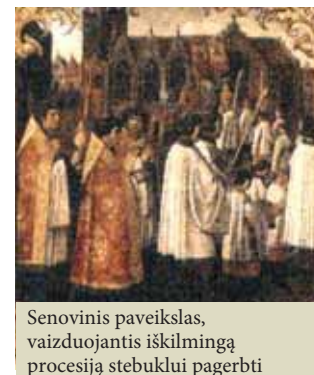
Senovinis paveikslas, vaizduojantis išskilmingą procesiją stebuklui pagerbti