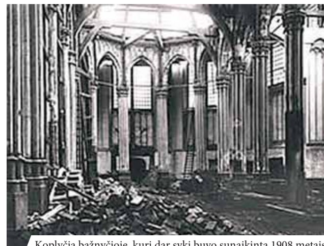
Koplyčia bažnyčioje, kuri dar sykį buvo sunaikinta 1908 metais