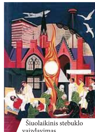
Šiuolaikinis stebuklo vaizdavimas