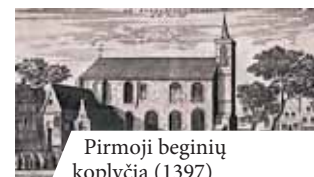
Pirmoji beginių koplyčia (1397)