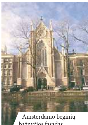
Amsterdamo beginių bažnyčios fasadas