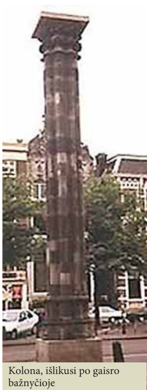
Kolona, išlikusi po gaisro bažnyčioje