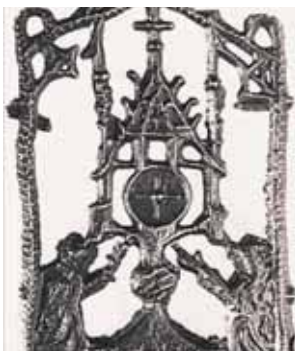
Skulptūrinis senovinės monstrancijos su stebuklingą Ostiją atvaizdas