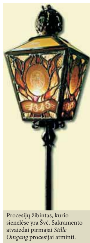
Procesijų žibintas, kurio sienelėse yra Švč. Sakramento atvaizdai pirmajai Stille Omgang procesijai atminti.