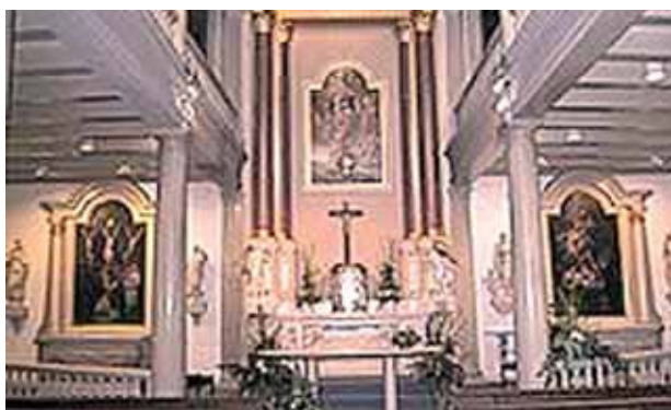
Švenčiausiojo Sakramento koplyčia