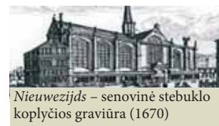
Nieuwezijds – senovinė stebuklo koplyčios graviūra (1670)