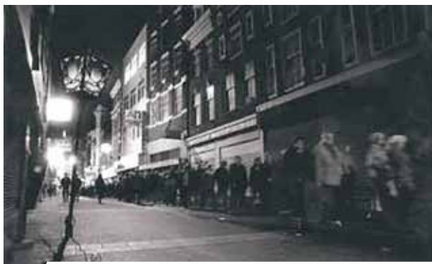
Stille Omgang procesija, kuria kasmet būdavo pagerbiamas stebuklo atminimas