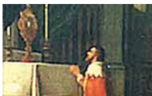
Didysis Austrijos kunigaikštis Maksimilijonas adoruoja stebuklingąją relikviją (1484)