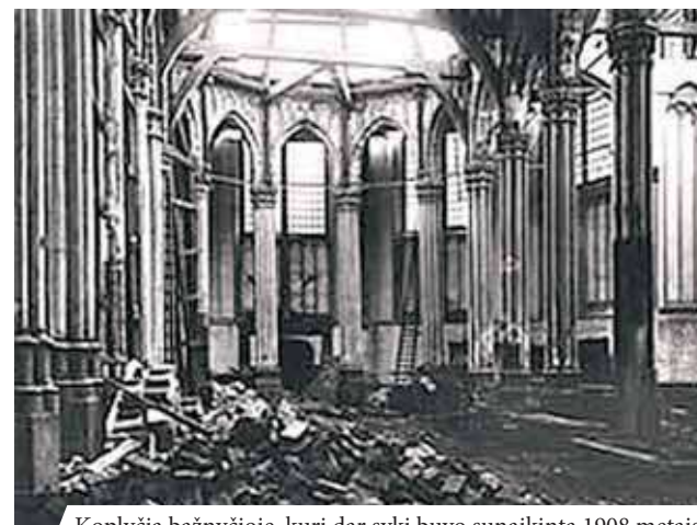
Koplyčia bažnyčioje, kuri dar sykį buvo sunaikinta 1908 metais