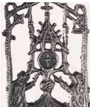
Skulptūrinis senovinės monstrancijos su stebuklingą Ostija atvaizdas