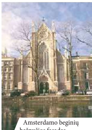
Amsterdamo beginių bažnyčios fasadas