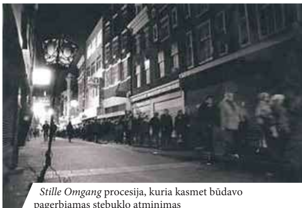
Stille Omgang procesija, kuria kasmet būdavo pagerbiamas stebuklo atminimas