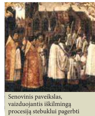
Senovinis paveikslas, vaizduojantis išskilmingą procesiją stebuklui pagerbti