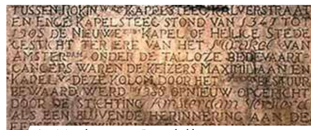
Atminimo lenta su aprašytu stebuklu