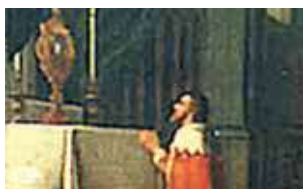
Didysis Austrijos kunigaikštis Maksimilijonas adoroja stebuklingąją relikviją (1484)