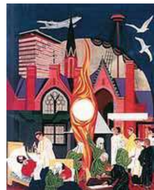
Šiuolaikinis stebuklo vaizdavimas