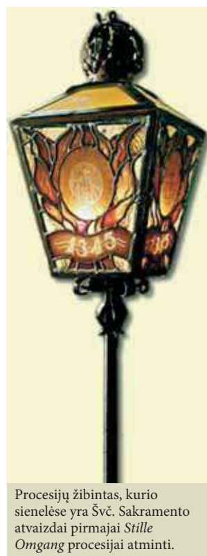
Procesijų žibintas, kurio sienelėse yra Švč. Sakramento atvaizdai pirmajai Stille Omgang procesijai atminti.