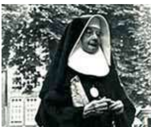
Beginių ordino vienuolė