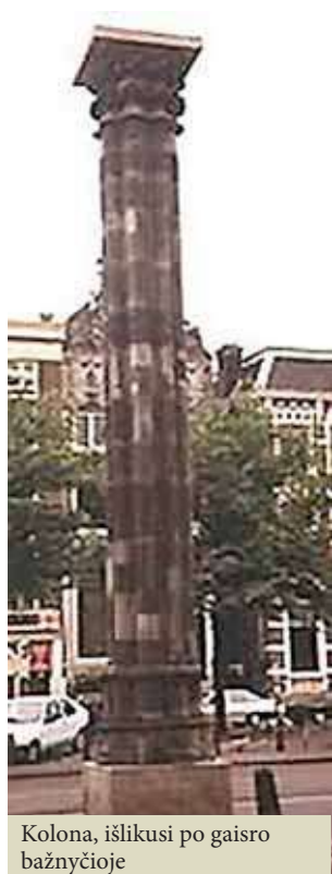
Kolona, išlikusi po gaisro bažnyčioje