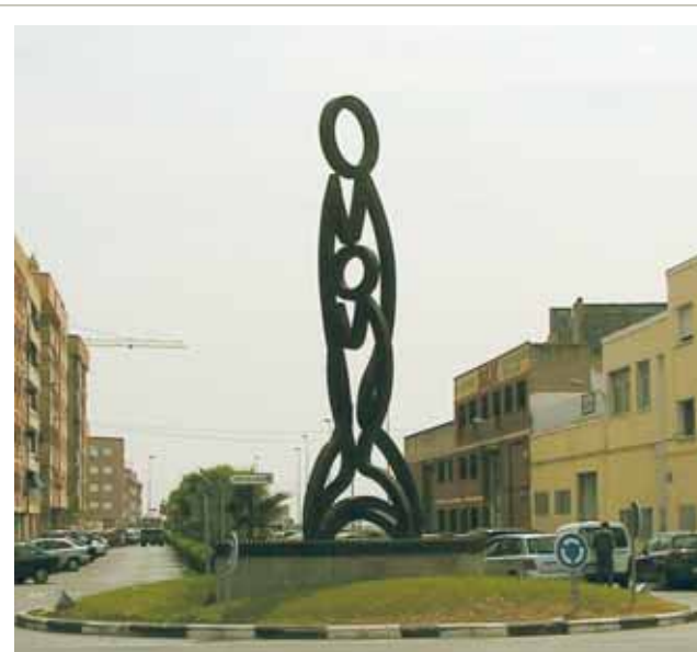
Stebuklo atminimo skulptūra miesto centre