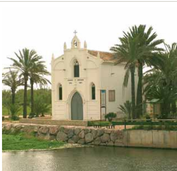
Ermitažo bažnyčia Alborache