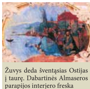
Žuvis deda šventąsias Ostijas į taurę. Dabartinės Almaseros parapijos interjero freska