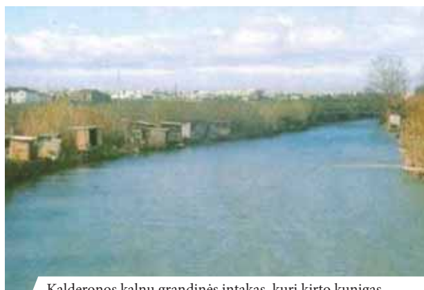
Kalderonos kalnų grandinės intakas, kurį kirto kunigas