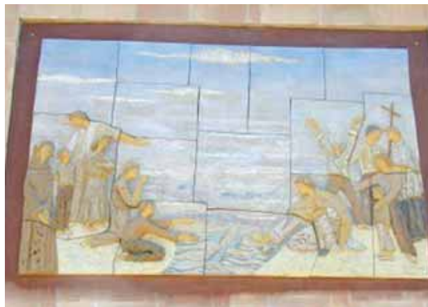
Mozaika bažnyčios išorėje