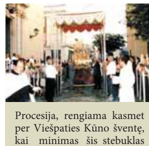
Procesija, rengiama kasmet per Viešpaties Kūno šventę, kai minimas šis stebuklas