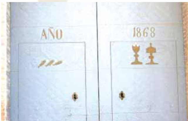
Stebuklo žuvis, pavaizduotos ant įėjimo į bažnyčią durų