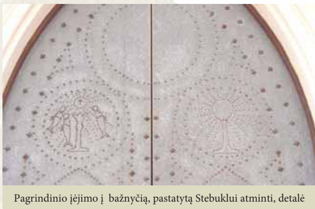
Pagrindinio įėjimo į bažnyčią, pastatytą Stebuklui atminti, detalė