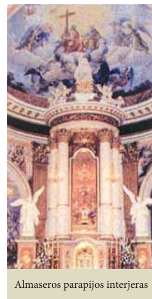
Almaseros parapijos interjeras