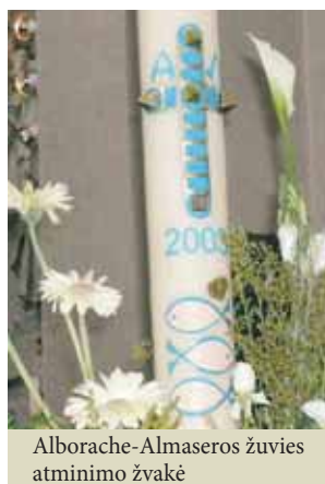
Alborache-Almaseros žuvis atminimo žvakė