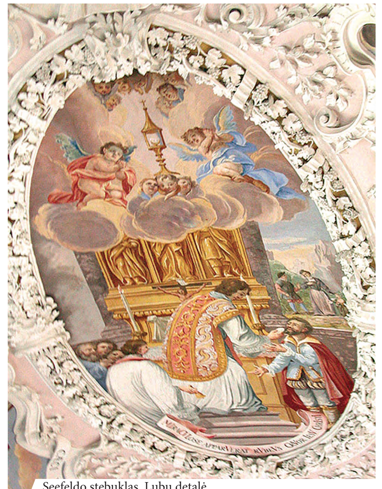
Seefeldo stebukas. Lubų detalė