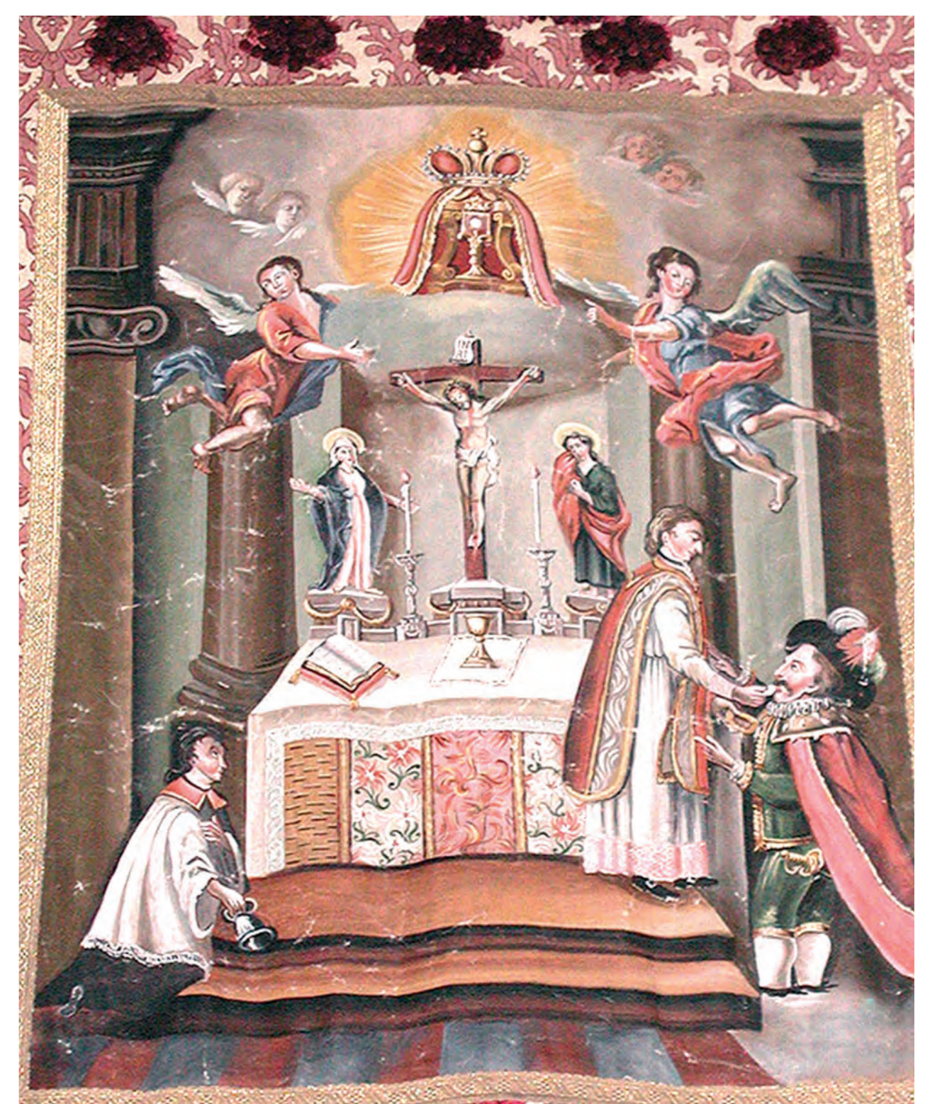
Šv. Osvaldo bažnyčios vėliava, vaizduojanti stebuko sceną