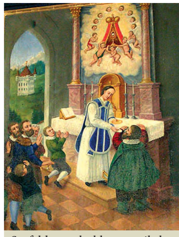
Seefeldo stebuko paveikslas, saugomas Elzbietos koplyčioje Hopfgartene