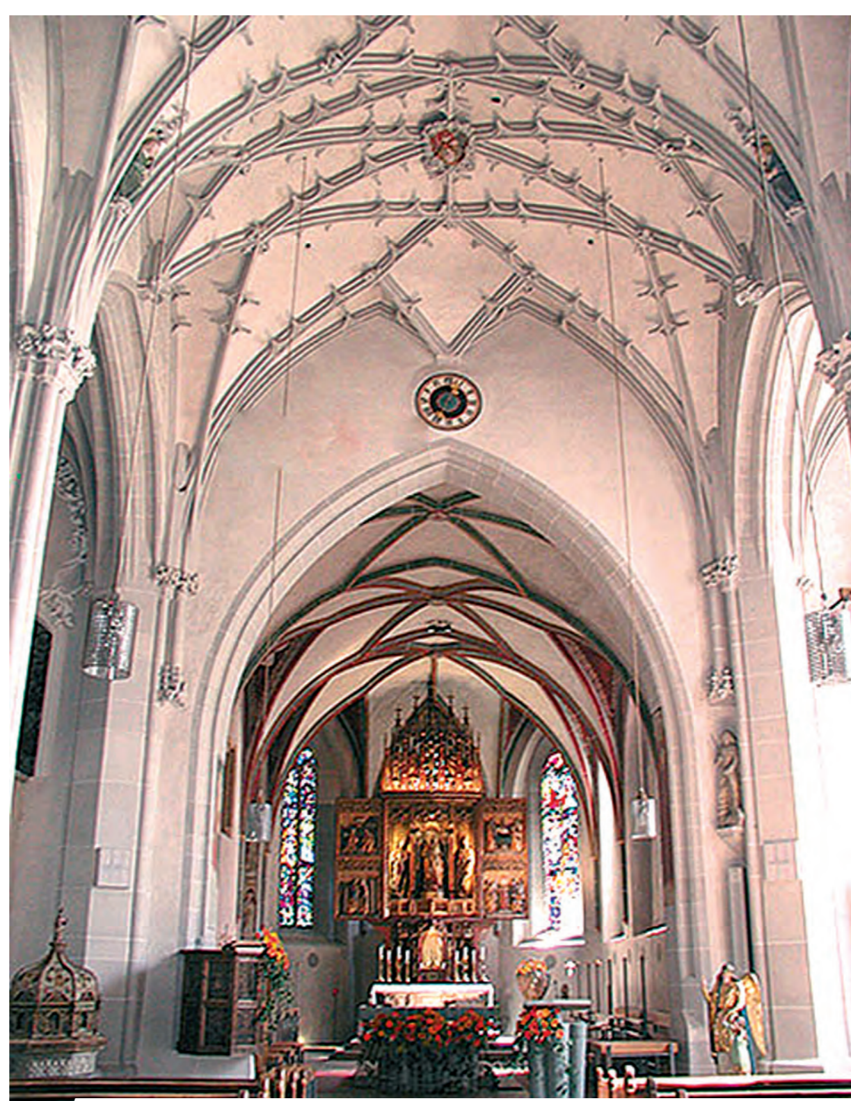
Pagrindinis Seefeldo šv. Osvaldo bažnyčios altorius