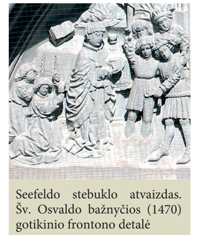
Seefeldo stebuko atvaizdas. Šv. Osvaldo bažnyčios (1470) gotikinio frontono detalė