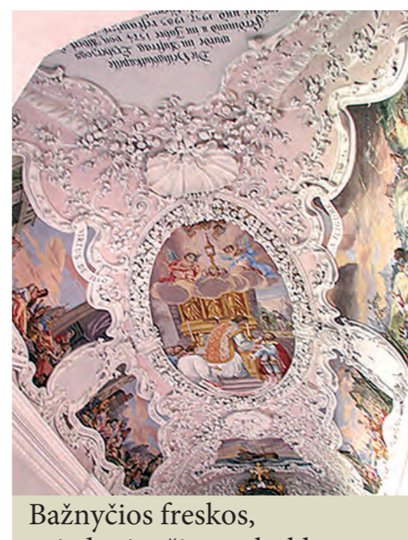
Bažnyčios freskos, vaizduojančios stebuklą