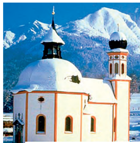
Šv. Osvaldo bažnyčia