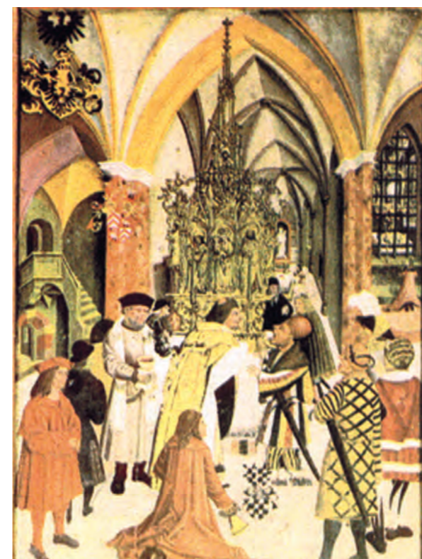
Senovinis stebuko paveikslas