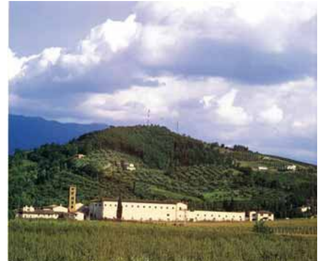
XVII a. įrašas ant bažnyčios fasado liudija, kad Rosano šv. Marijos abatija įsteigta 780