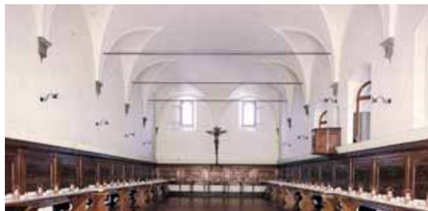
Refectory of the Abbey