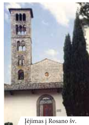
Įėjimas į Rosano šv. Marijos abatiją