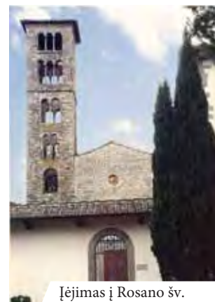
Įėjimas į Rosano šv. Marijos abatiją