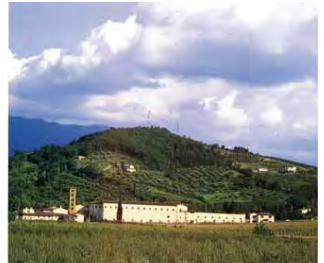
XVII a. įrašas ant bažnyčios fasado liudija, kad Rosano šv. Marijos abatija įsteigta 780