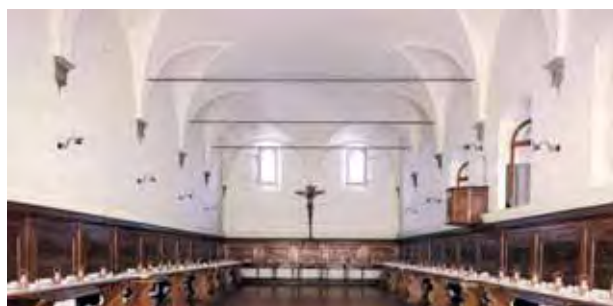
Refectory of the Abbey