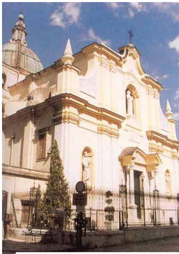
Patierno šv. Petro bažnyčia

1774 m. rugpjūčio 29 d. Neapolio arkivyskupijos kurija palankiai atsiliepė apie stebuklingai atrastas ir nepaaiškinamai išsilaikiusias Ostijas, kurios buvo pavogtos iš Patierno šv. Petro bažnyčios 1772 m. vasario 24 d. 1971-uosius arkivyskupija paskelbė Eucharistijos metais, kad tikintieji prisimintų ir geriau suprastų šio Eucharistijos stebuklo reikšmę. Deja, 1978 metais relikvijorius su stebuklingai išlikusiomis 1772 m. Ostijomis buvo pavogtas.