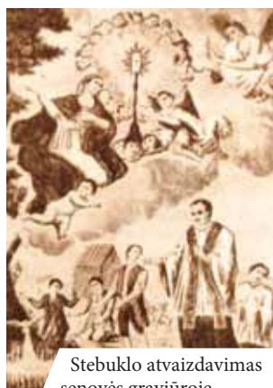
Stebuklo atvaizdavimas senovės graviūroje