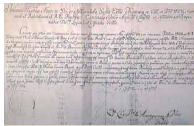
Dokumentas, kuriuo kardinolas Ursis paskelbia šv. Petro bažnyčią diecezine Eucharistijos šventove