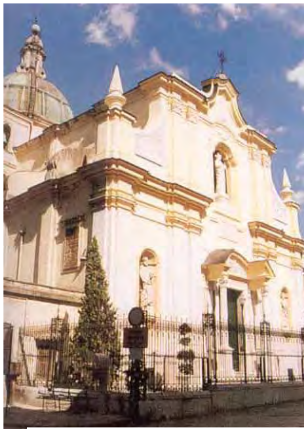
Patierno šv. Petro bažnyčia

1774 m. rugpjūčio 29 d. Neapolio arkivyskupijos kurija palankiai atsiliepė apie stebuklingai atrastas ir nepaaiškinamai išsilaikiusias Ostijas, kurios buvo pavogtos iš Patierno šv. Petro bažnyčios 1772 m. vasario 24 d. 1971-uosius arkivyskupija paskelbė Eucharistijos metais, kad tikintieji prisimintų ir geriau suprastų šio Eucharistijos stebuklo reikšmę. Deja, 1978 metais relikvijorius su stebuklingai išlikusiomis 1772 m. Ostijomis buvo pavogtas.