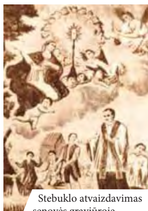
Stebuklo atvaizdavimas senovės graviūroje