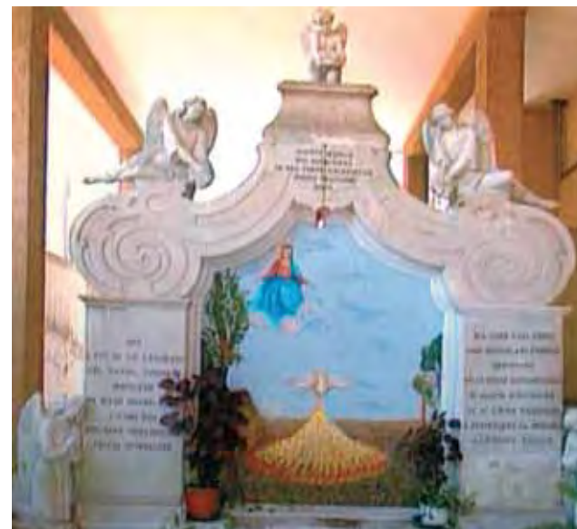
Atminimo akmo, pastatytas vietoje, kur buvo rastos Ostijos