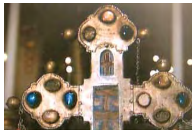
Padidintas Ostijos relikvijos, esančios brangiaame kryžiuje, vaizdas. Autorinis Venecijos auksakalio darbas (XIII a.)