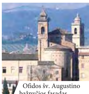
Ofidos šv. Augustino bažnyčios fasadas