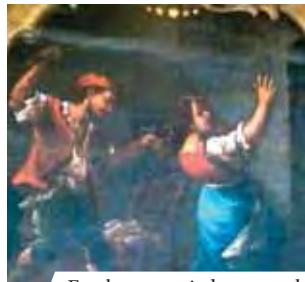
Freskose atvaizduotas stebuklas