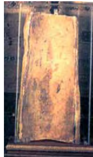
Ąsotis, kuriame įvyko stebuklas