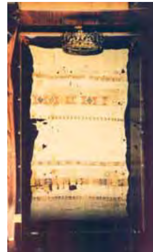
Sukrūvintos lininės staltiesės, į kurią Ričiatela suvyniojo Ostiją, relikvija