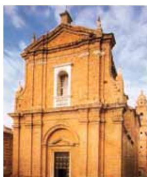
Šv. Baltramiejaus bažnyčia