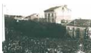
Procesija Morovalyje stebuklo garbei