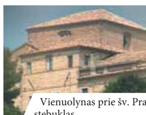
Vienuolynas prie šv. Pranciškaus bažnyčios, kurioje įvyko stebuklas