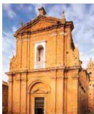
Šv. Baltramiejaus bažnyčia