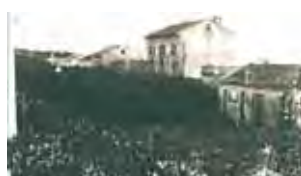
Procesija Morovalyje stebuklo garbei