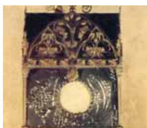
Relikvinis akmuo, saugomas šv. Bernardino parapijoje