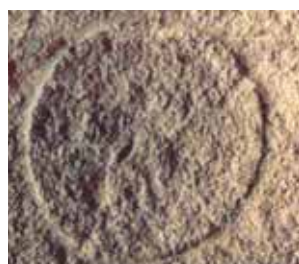
Antrosios Ostijos išspaudas