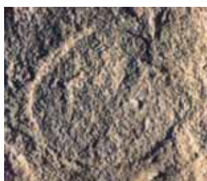
Pirmosios Ostijos išspaudas