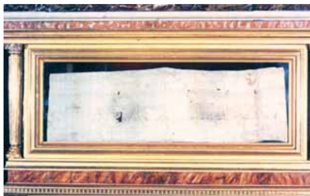
Korporalo su Kraujo dėmėmis relikvija