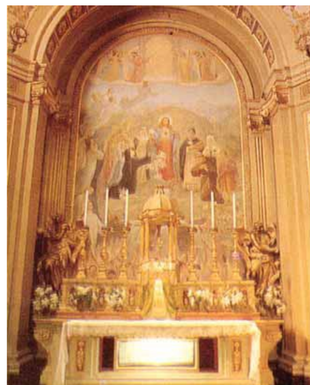
Švenčiausiojo Sakramento koplyčia, kur saugoma relikvija

1494 metais Mačeratoje buvo įsteigta viena pirmųjų brolių Švenčiausiojo Sakramento garbei. Mačeratoje 1556 metais atsirado ir maldingoji Keturiasdešimties valandų adoracijos praktika. Kasmēt Devintinių procesijoje paskui Švenčiausiąjį Sakramentą nešama ir korporalo relikvija.