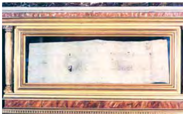
Korporalo su Kraujo dėmėmis relikvija