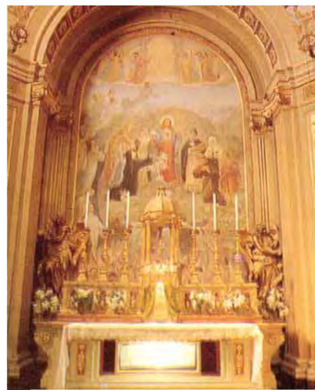
Švenčiausiojo Sakramento koplyčia, kur saugoma relikvija

1494 metais Mačeratoje buvo įsteigta viena pirmųjų brolijų Švenčiausiojo Sakramento garbei. Mačeratoje 1556 metais atsirado ir maldingoji Keturiasdešimties valandų adoracijos praktika. Kasmēt Devintinių procesijoje paskui Švenčiausiąjį Sakramentą nešama ir korporalo relikvija.