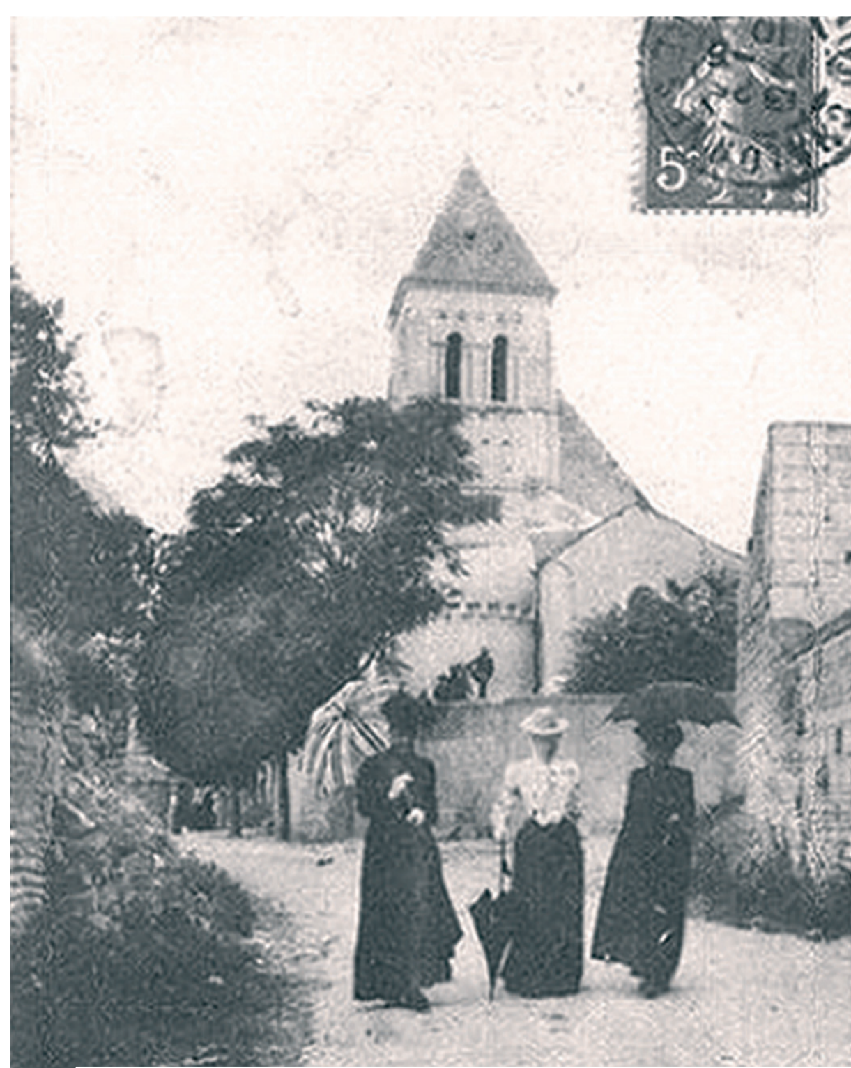
Ulmų parapijos bažnyčia