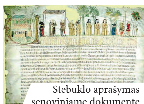
Stebuklo aprašymas senoviniame dokumente