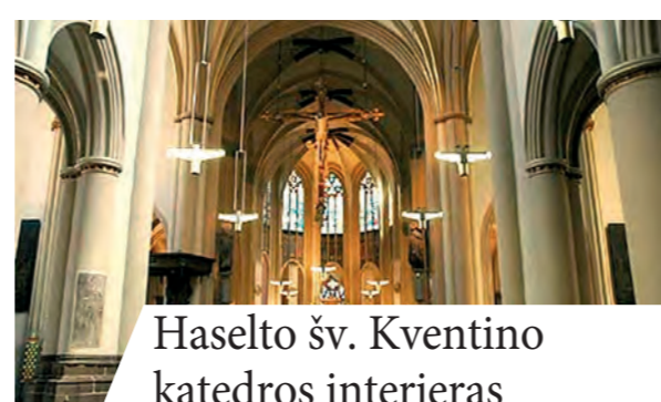
Haselto šv. Kventino katedros interjeras