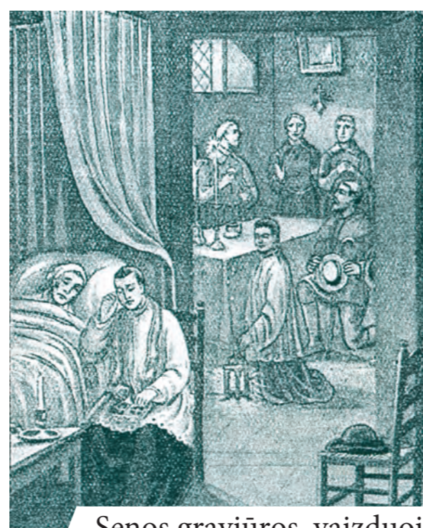
Senos graviūros, vaizduojančios stebuklą