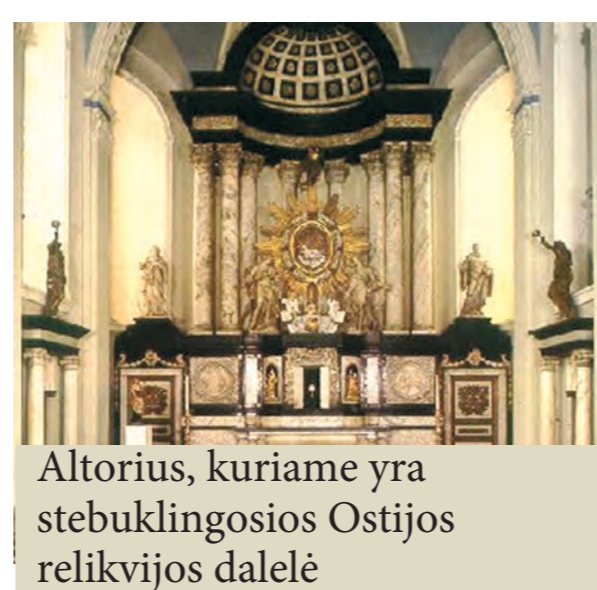
Altorius, kuriame yra stebuklingosios Ostijos relikvijos dalelė