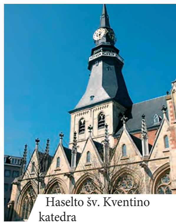
Haselto šv. Kventino katedra