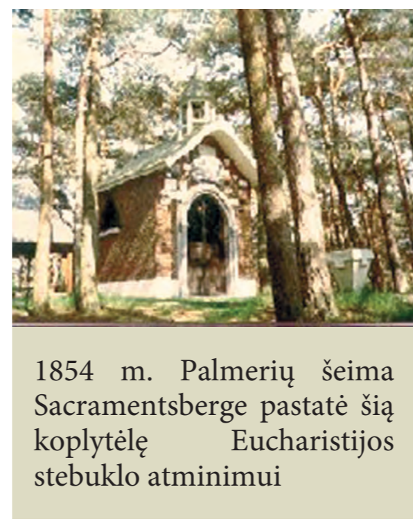
1854 m. Palmerių šeima Sacramentsberge pastatė šią koplytėlę Eucharistijos stebuklo atminimui