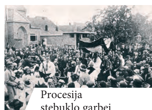
Procesija stebuklo garbei