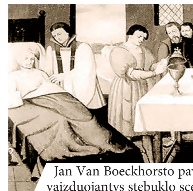
Jan Van Boeckhorsto paveiksliai Haselto katedroje, vaizduojantys stebuklo scenas