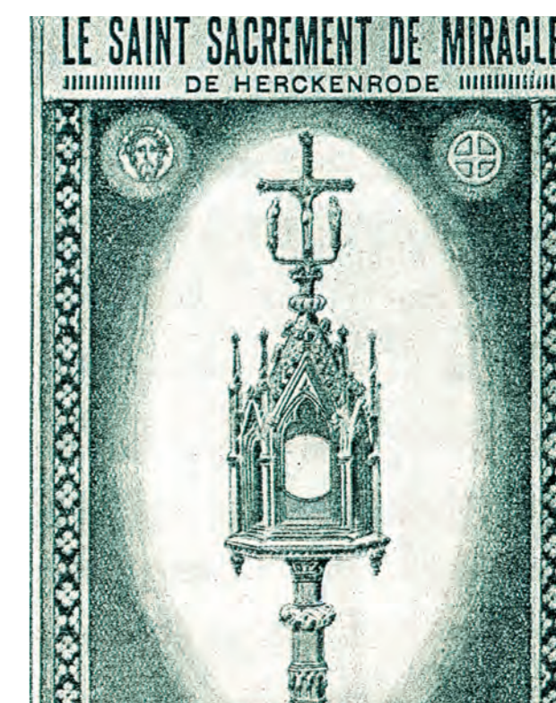
Monstrancija, kurioje būdavo nešama stebuklingoji Ostija per procesijas