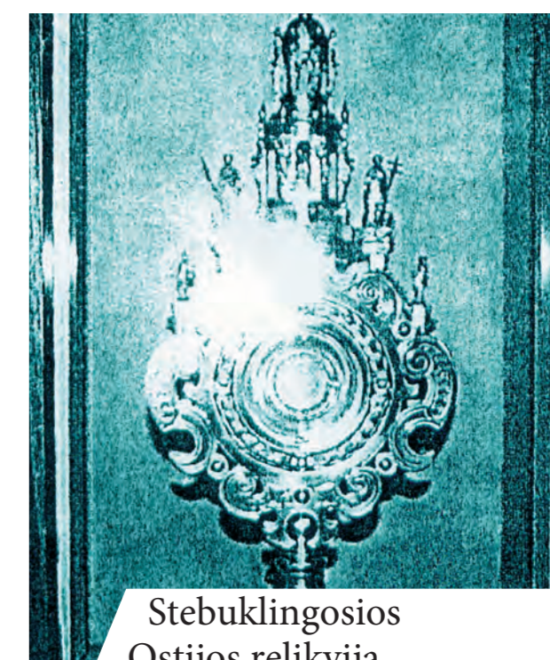
Stebuklingosios Ostijos relikvija

Viverselio bažnyčios kunigas 1317 m. liepos 25 d. buvo pakviestas pas sunkiai sergantį parapijietį suteikti jam Ligonijų patepimą.