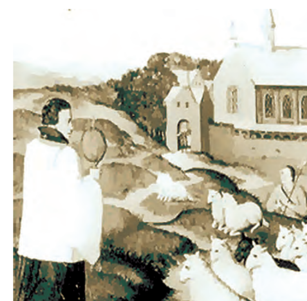
Paveikslas Haselto šv. Kventino katedroje, kur galima matyti pagarbiai atsiklaupusią avių bandą Sakramento kalne praeinant kunigui su šventąja relikvija