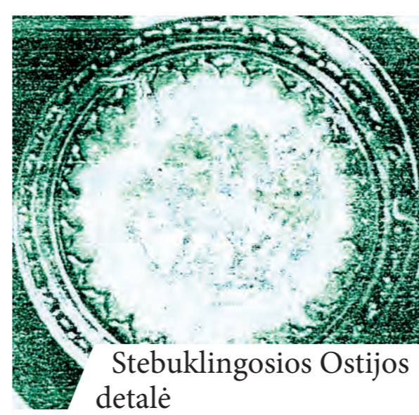
Stebuklingosios Ostijos detalė