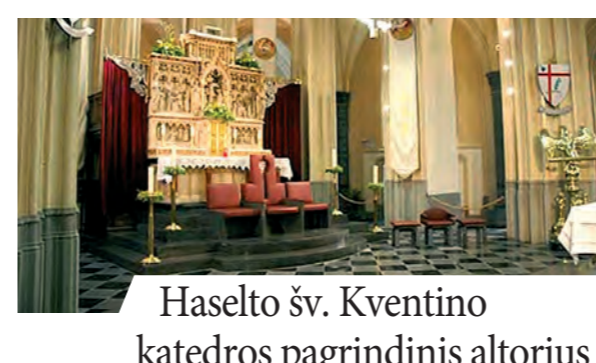
Haselto šv. Kventino katedros pagrindinis altorius