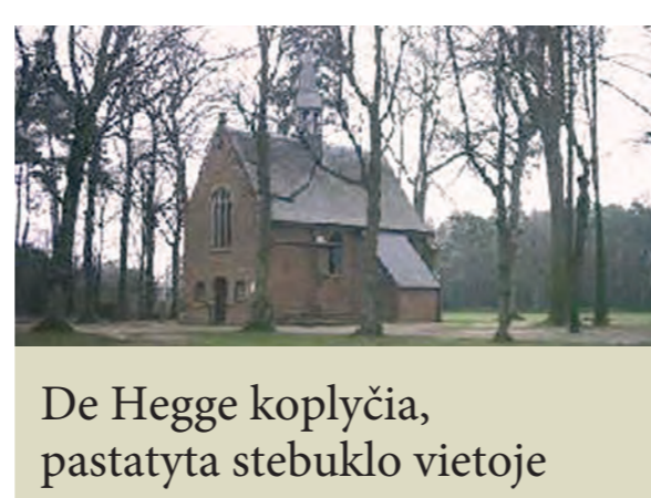
De Hegge koplyčia, pastatyta stebuklo vietoje