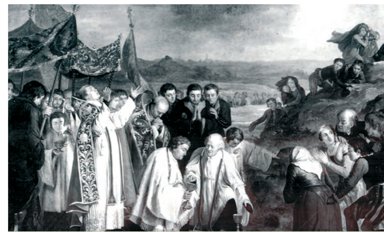
A. Van Ysendyck (1801 – 1875) paveikslų serija Šventasis tvoros stebuklas, šv. Valtrūdos bažnyčia