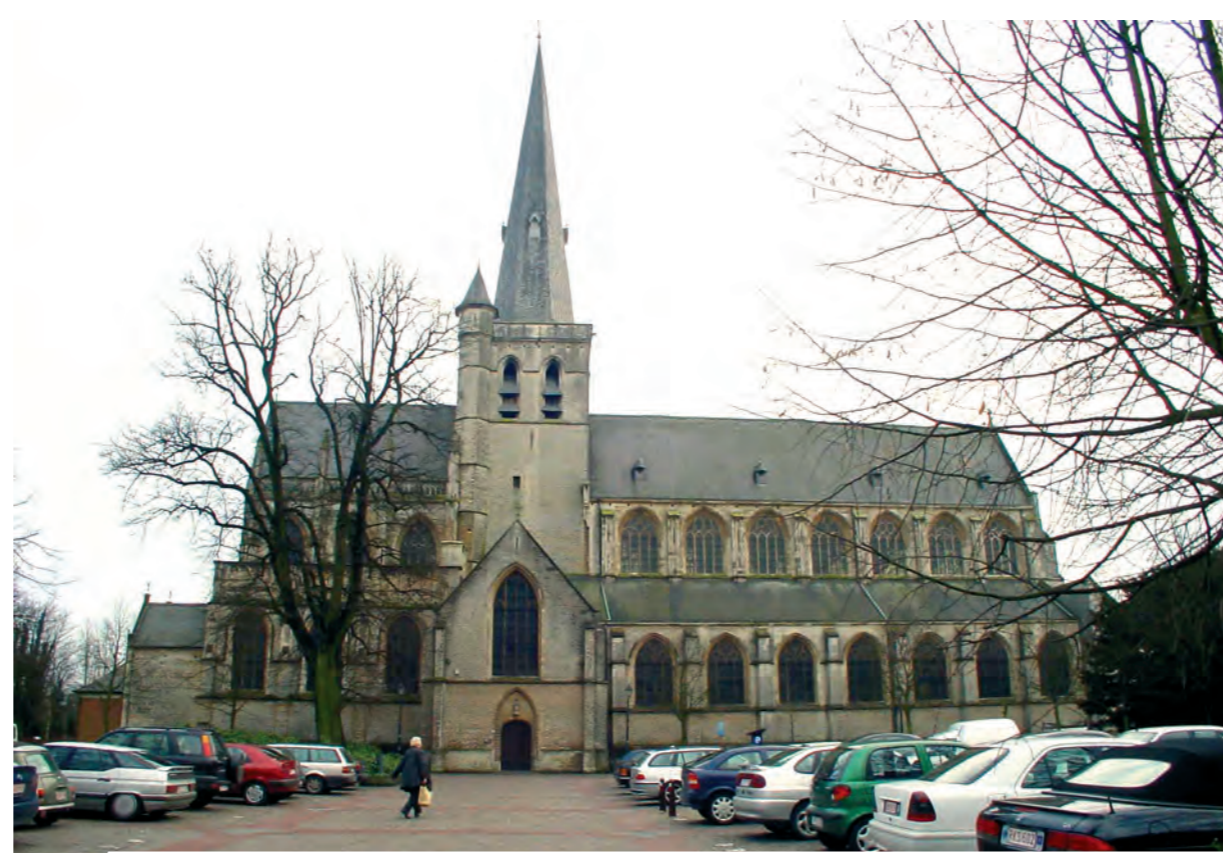
Herentalio šv. Valtrūdos bažnyčia