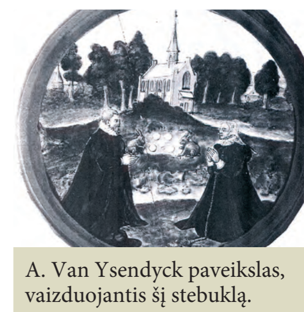
A. Van Ysendyck paveikslas, vaizduojantis šį stebuklą.