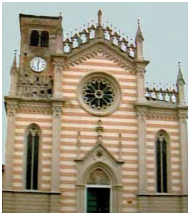
Valvasonės Švč. Kristaus Kūno bažnyčia, kurioje saugoma Krauju sutepta altoriaus staltiesė

Tarp autoritetingiausių dokumentų, kuriuose aprašomas 1294 metais Gruare įvykęs Eucharistijos stebuklas, yra ir vietinio istoriko Antonijaus Nikolečio darbas (1765). Moteris skalbė altoriaus užtiesalus kaimo skalbykloje ant Versiolos kanalo ir staiga pastebėjo, kad viena staltiesė nusidažė krauju. Atidžiau pasižiūrėjusi pamatė, kad kraujas teka iš konsekruotos Ostijos, užsilikusios tarp staltiesės klosčių.