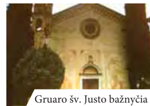
Gruaro šv. Justo bažnyčia