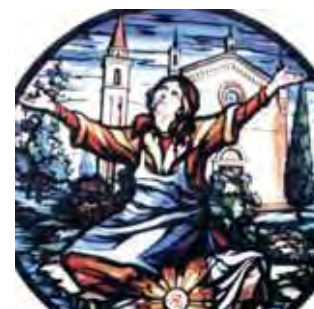
Stebuklo atvaizdas rozetėje. Gruaro bažnyčia.