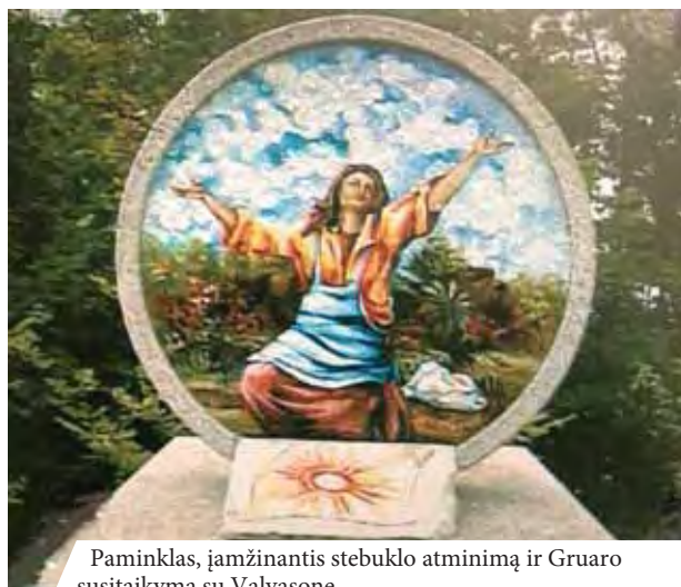
Paminklas, įamžinantis stebuklo atminimą ir Gruaro susitaikymą su Valvasone