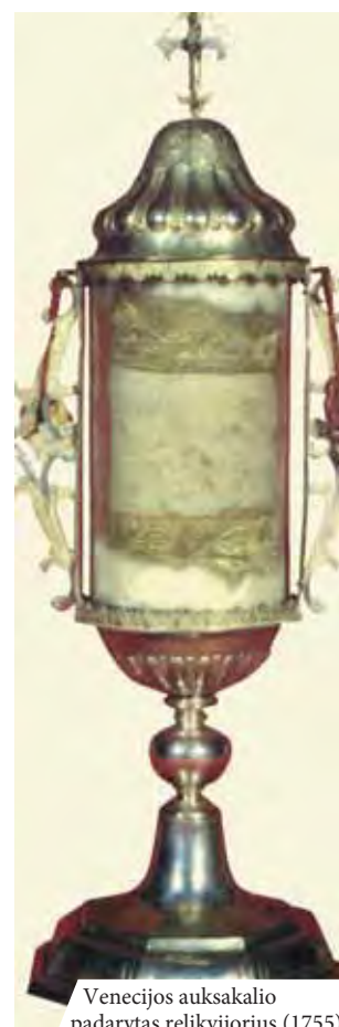
Venecijos auksakalio padarytas relikvijorius (1755)