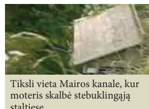
Tikslī vieta Mairos kanale, kur moteris skalbė stebuklingąją staltiesę