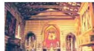
Švč. Kristaus Kūno bažnyčios interjeras