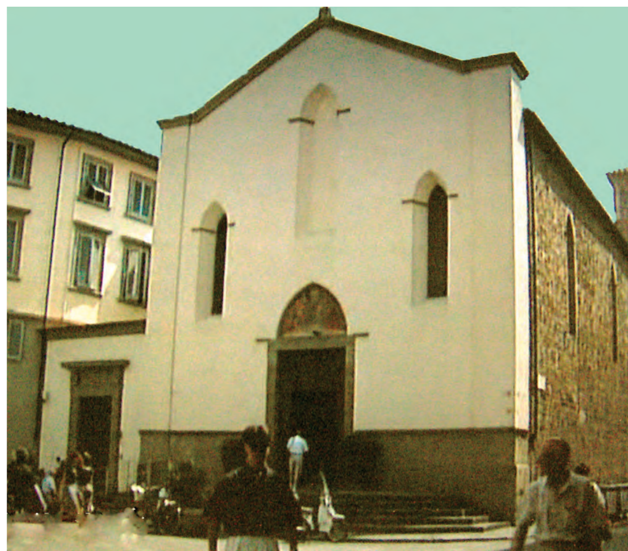
Šventojo Ambraziejaus bazilika, Florencija

Kitas eucharistinis stebuklas įvyko 1595 m. Didįjį penktadienį, kai bažnyčios gaisro metu stebuklingai nenukentėjo keli Ostijos fragmentai.