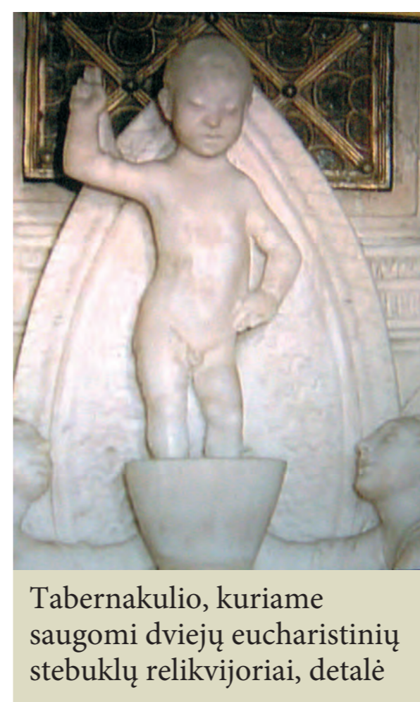
Tabernakulio, kuriame saugomi dviejų eucharistinių stebuklų relikvijoriai, detalė