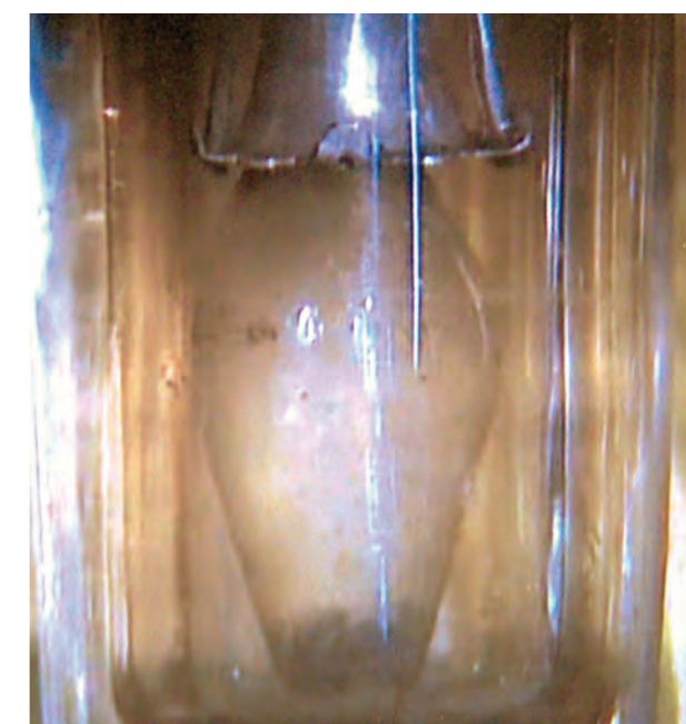
Vyno lašų, virtusių gyvu Krauju, relikvijorius