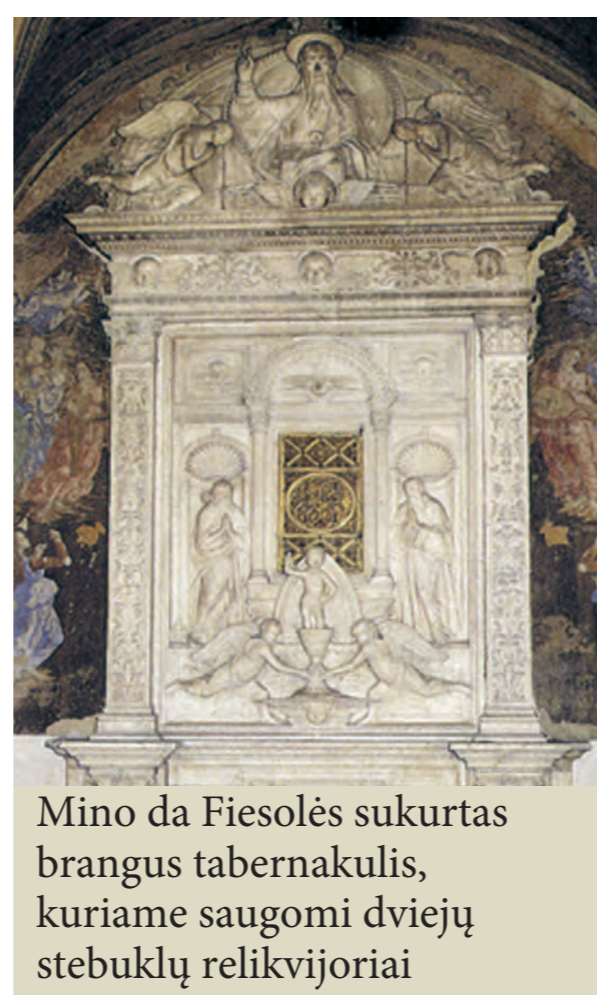
Mino da Fiesolės sukurtas brangus tabernakulis, kuriame saugomi dviejų stebuklų relikvijoriai