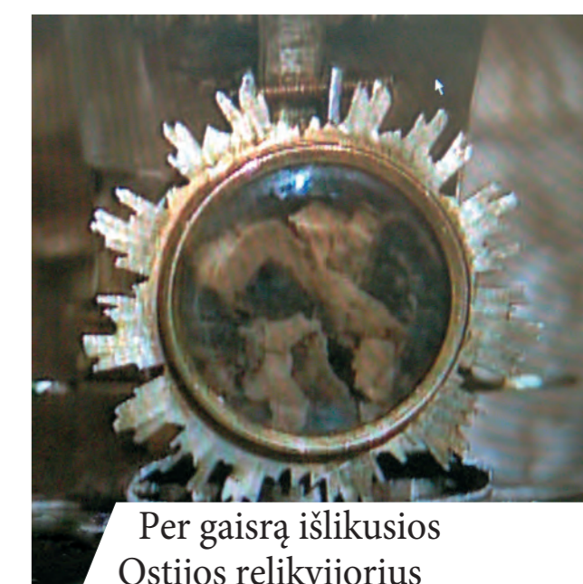
Per gaisrą išlikusios Ostijos relikvijorius