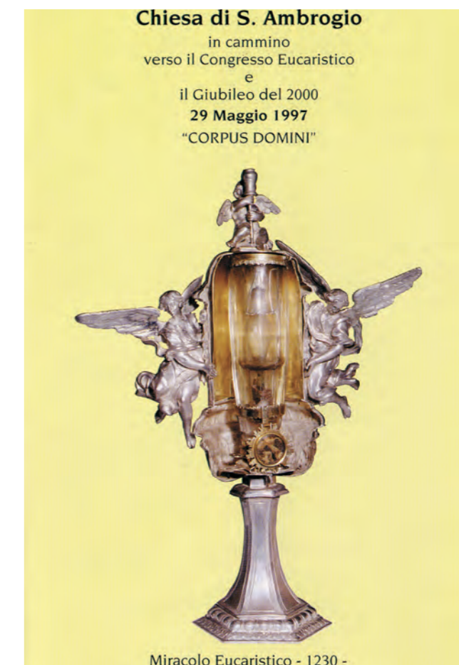
Chiesa di S. Ambrogio In cammino verso il Congresso Eucaristico e il Giubileo del 2000 29 Maggio 1997 "CORPUS DOMINI"