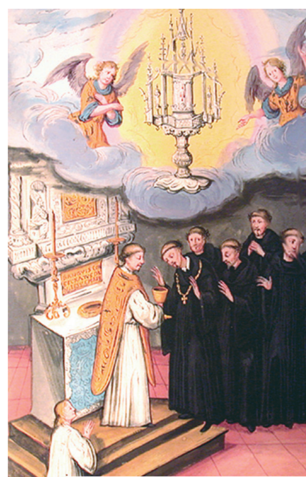
Paveikslas, vaizduojantis stebuklą.