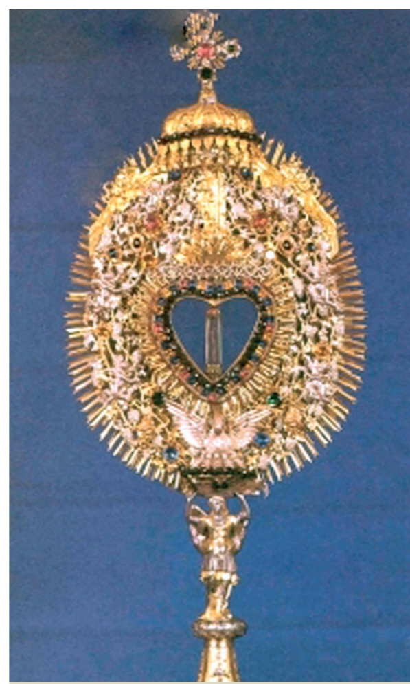
1719 m. monstrancija (sidabras, auksas), kurioje saugomas Brangiausias Kraujas.

Mažas St. Georgenberg-Fiecht kaimelis Ino slėnyje yra labai gerai žinomas dėl 1310 metais ten įvykusio Eucharistijos stebuklo. Per Mišias kunigą apėmė abejonės dėl realios Jėzaus esaties konsekruotuose eucharistiniuose pavidaluose. Iškart po konsekracijos vynas pavirto krauju, užvirė ir išsiliejo per taurės kraštus. 1480 m., praėjus 170 metų po šio stebuklo, metraštininkas rašė: „Švenčiausias Kraujas tebėra šviežias lyg tekėtų iš žaizdos.“ Brangiausias Kraujas liko nepakitęs iki šių dienų ir saugomas relikvijoriuje Šv. Georgenbergo vienuolyne.