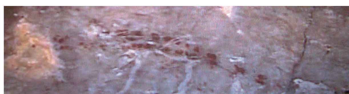
Krauju aptašytas skliautas. Detalė