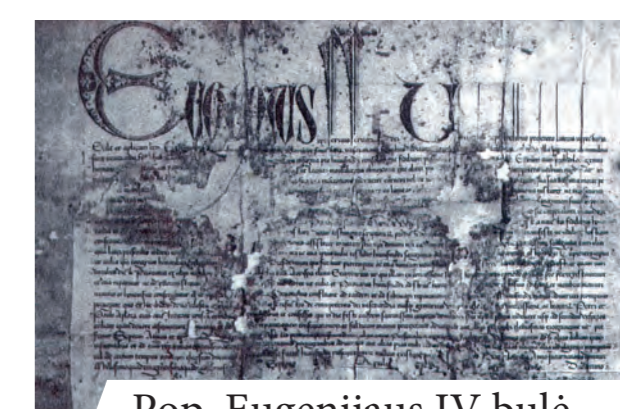
Pop. Eugenijaus IV bulė