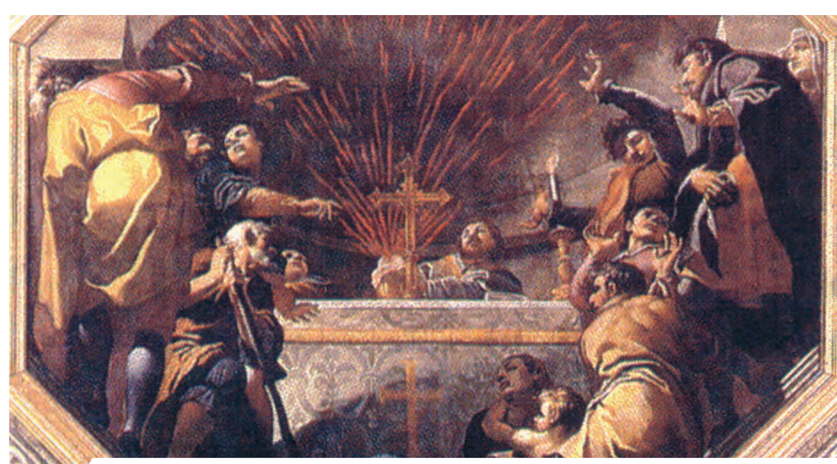
Bodoni, Kraujo stebuklas. Lubų tapyba