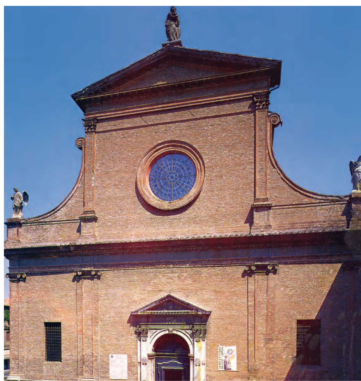
Šv. Marijos ant Brastos bažnyčia Feraroje