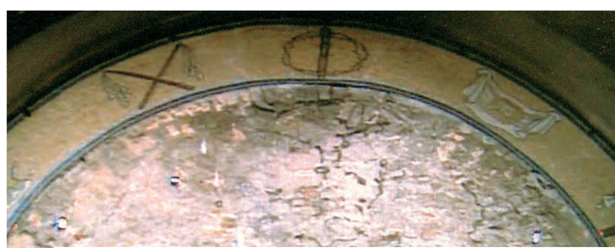
Krauju aptašytas kriptos skliautas