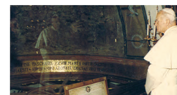
Šv. popiežius Jonas Paulius II meldžiasi Feraroje