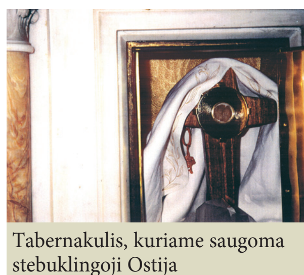
Tabernakulis, kuriame saugoma stebuklingoji Ostija