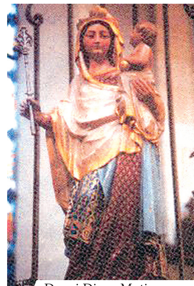
Douai Dievo Motina