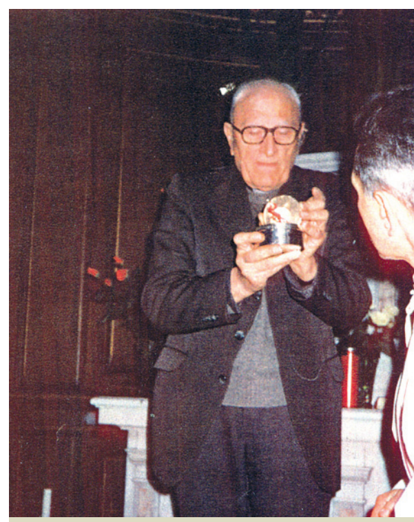
1975-ieji metai. Šv. Petro bažnyčios klebonas rodo 1254 metų Ostiją

Douai eucharistinis stebuklas įvyko, kai kunigui dalijant Komuniją Ostija nukrito ant žemės. Kunigas pasilenkė ją pakelti, bet Ostija pati pakilo ir nusileido ant purifikatoriaus. Po kelių akimirų pasirodė nuostabus Vaikelis, kurį galėjo kontempliuoti visi ten buvę tikintieji ir vienuoliai. Ir šiandien, prabėgus beveik 800 metų, ši stebuklinga Ostija kiekvieną ketvirtadienį išstatoma viešam garbinimui Douai šv. Petro bažnyčioje ir daug tikinčiųjų susirenka prie jos pasimelsti.