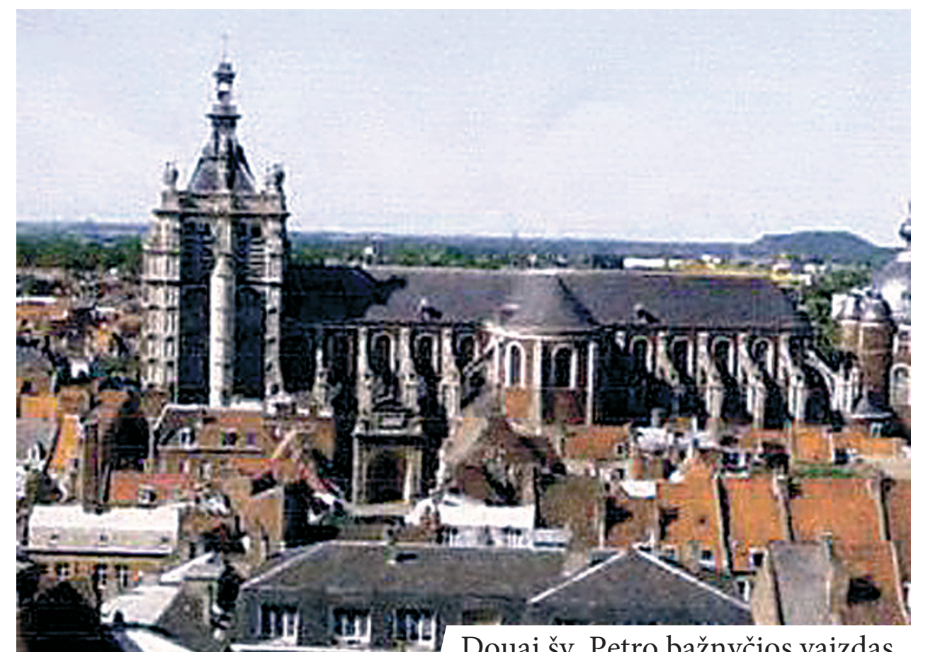
Douai šv. Petro bažnyčios vaizdas