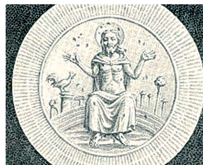
Ostija, kurią popiežius Eugenijus IV nusiuntė Burgundijos kunigaikščiui Pilypui Gražiajam

Apie šį įvykį greitai sužinojo net popiežius Eugenijus IV, kuris panorė dovanoti stebuklingą Ostiją Burgundijos kunigaikščiui Pilypui, kuris savo ruožtu