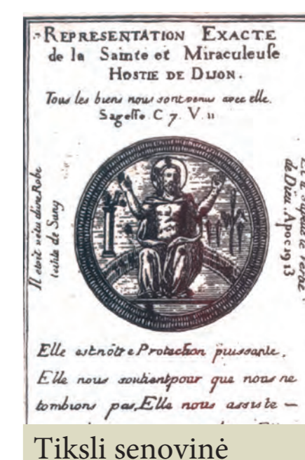
Tiksli senovinė Švenčiausiosios stebuklingosios Dižono Ostijos kopija