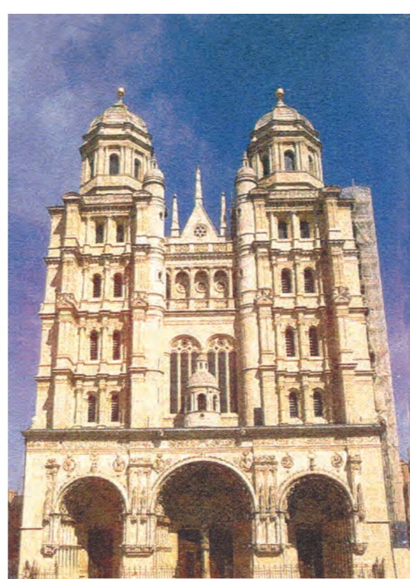
Dižono šv. Mykolo bazilika