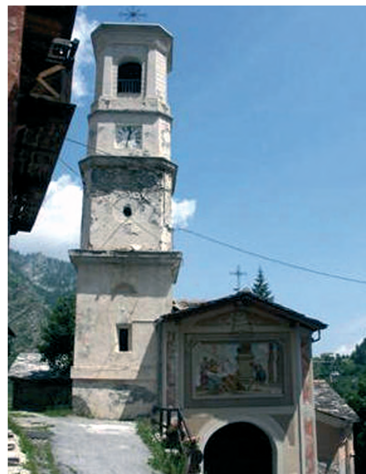
Kanozijaus parapiinė bažnyčia

Kanozijas – Saluco vyskupijos kaimelis Mairos upės slėnyje. 1630 metais vietiniai gyventojai apdrungno ir kalvinizmo įtakoje nebepraktikavo tikėjimo. Praėjus kelioms dienoms po Devintinių Mairos upė dėl liūčių patvino, išėjo iš krantų. Sraunūs vandenys paplovė didžiulius kalno akmenis ir jie su trenksmu nuriedėjo slėnio ir kaimo link.