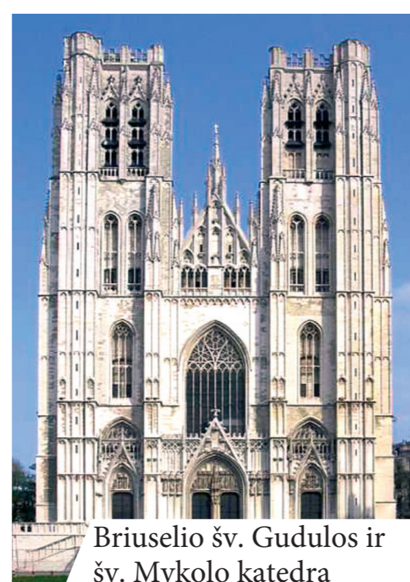
Briuselio šv. Gudulos ir šv. Mykolo katedra