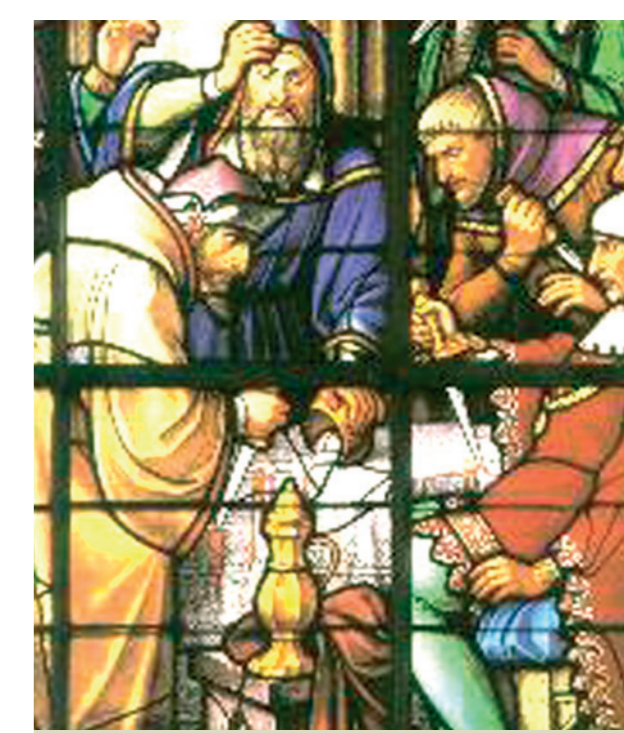
Eucharistinį stebuklą vaizduojančio vitražo dalis šv. Gudulos ir šv. Mykolo katedroje