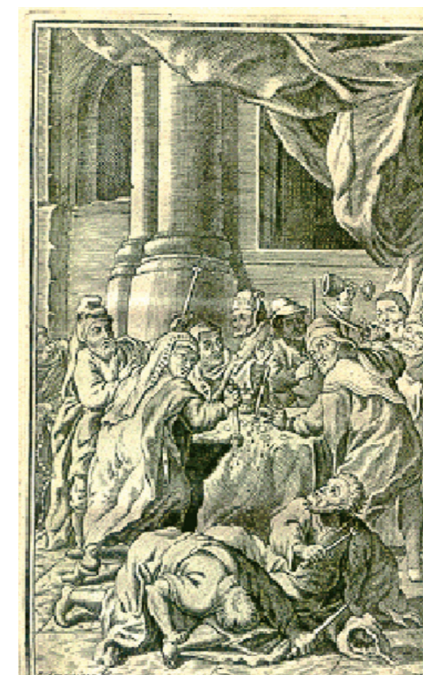
Senovinės graviūros, vaizduojančios eucharistinį stebuklą