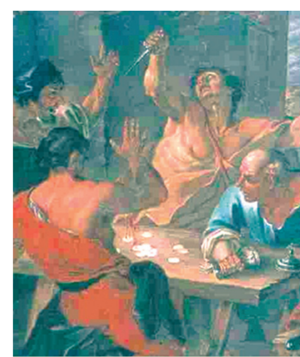
Eucharistinis stebuklas Briuselyje (Hierono muziejus, Parej-Monialis)