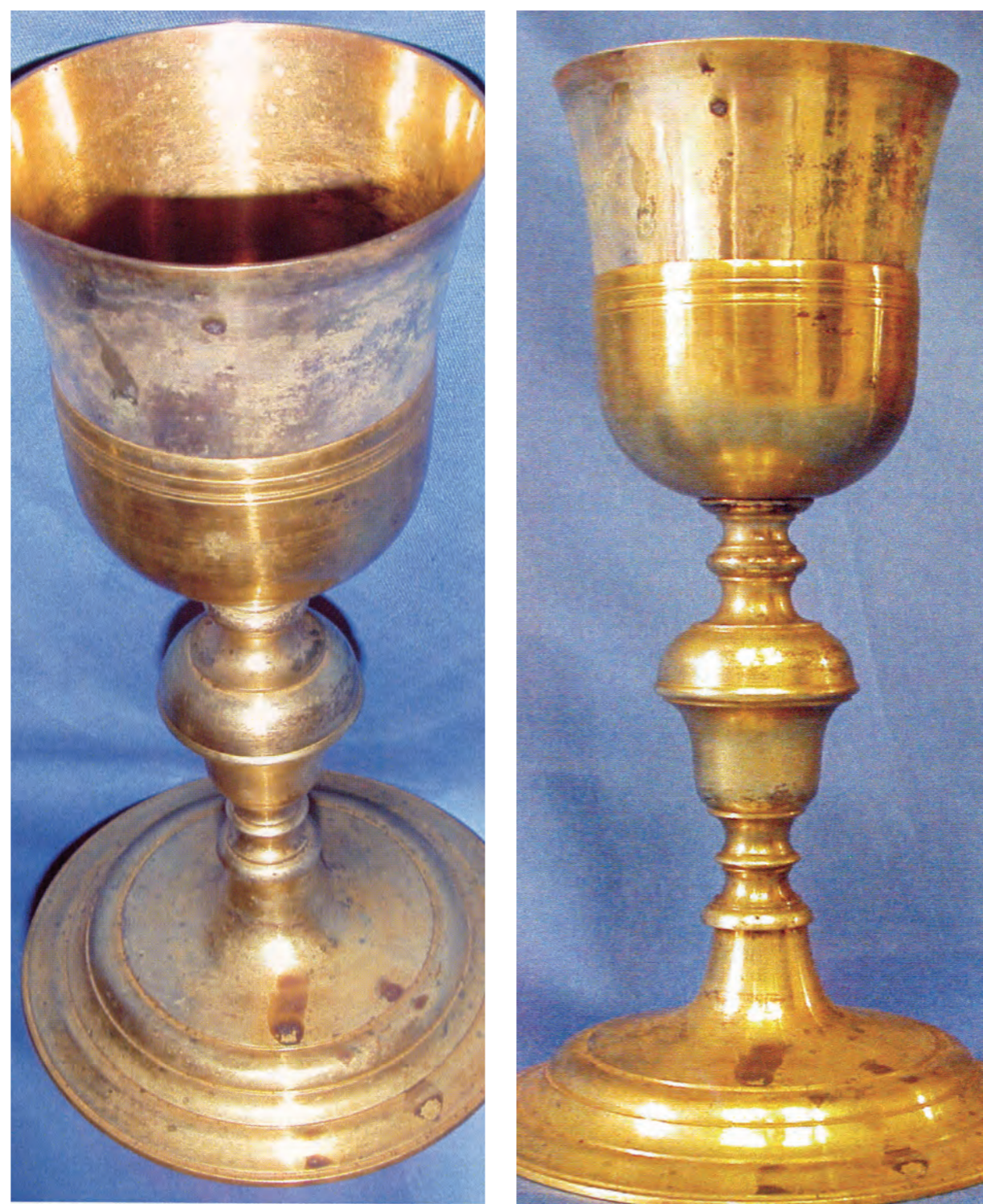
Opera Pia Milliavacca. 1718 –ųjų metų stebuklo Mišių taurė. Atkreipkite dėmesį į Kraujo dėmelį ant pačios taurės ir ant jos pagrindo atitikimą

Antrasis stebuklas įvyko senoje Opera Pia Milliavacca koplyčioje, jis patvirtintas daugybės notaro surinktų liudijimų, kuriuos pasirašė Mišias celebravęs kunigas ir garsios bažnytinės bei pasaulietinės asmenybės.