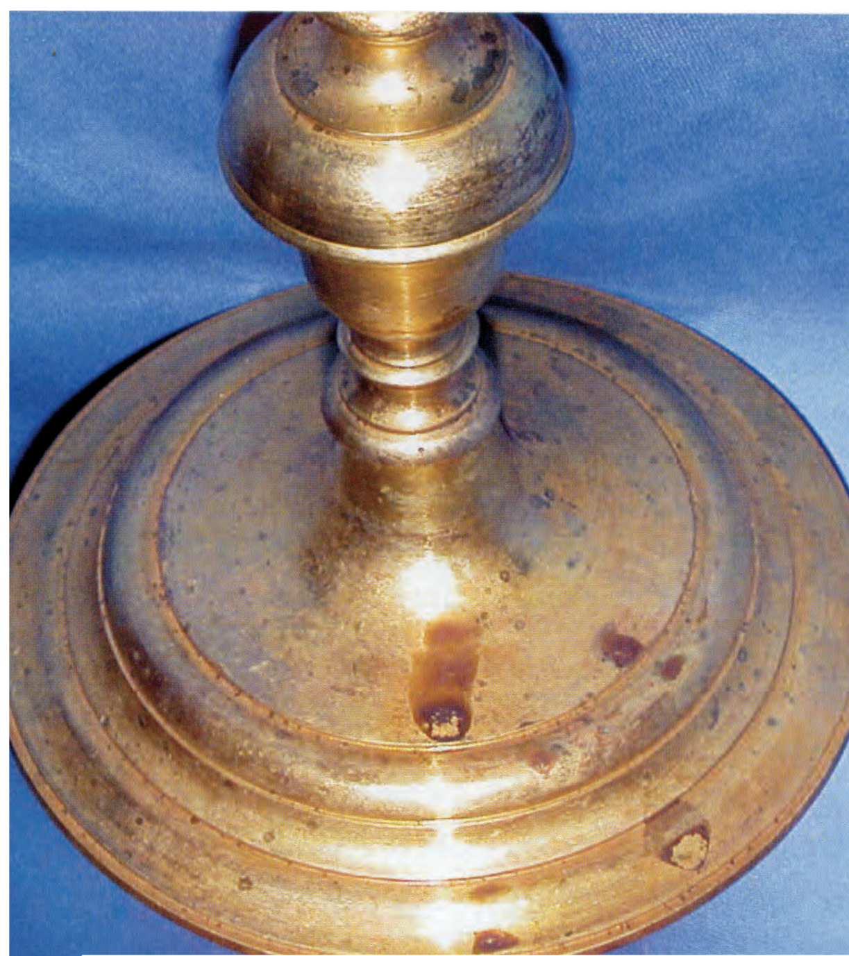
Opera Pia Milliavacca įvykusio stebuklo taurės pagrindas.