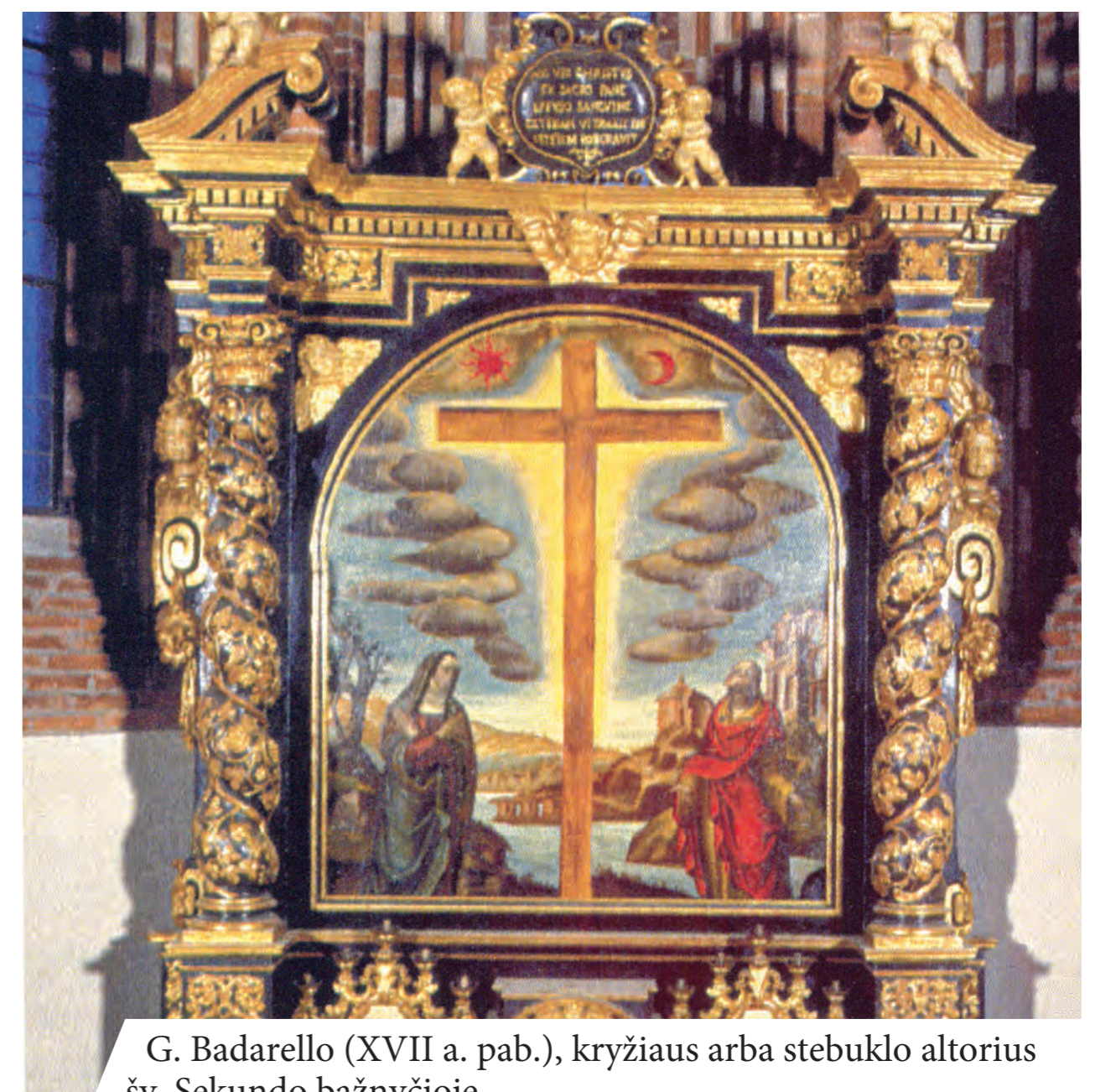
G. Badarello (XVII a. pab.), kryžiaus arba stebuklo altorius šv. Sekundo bažnyčioje