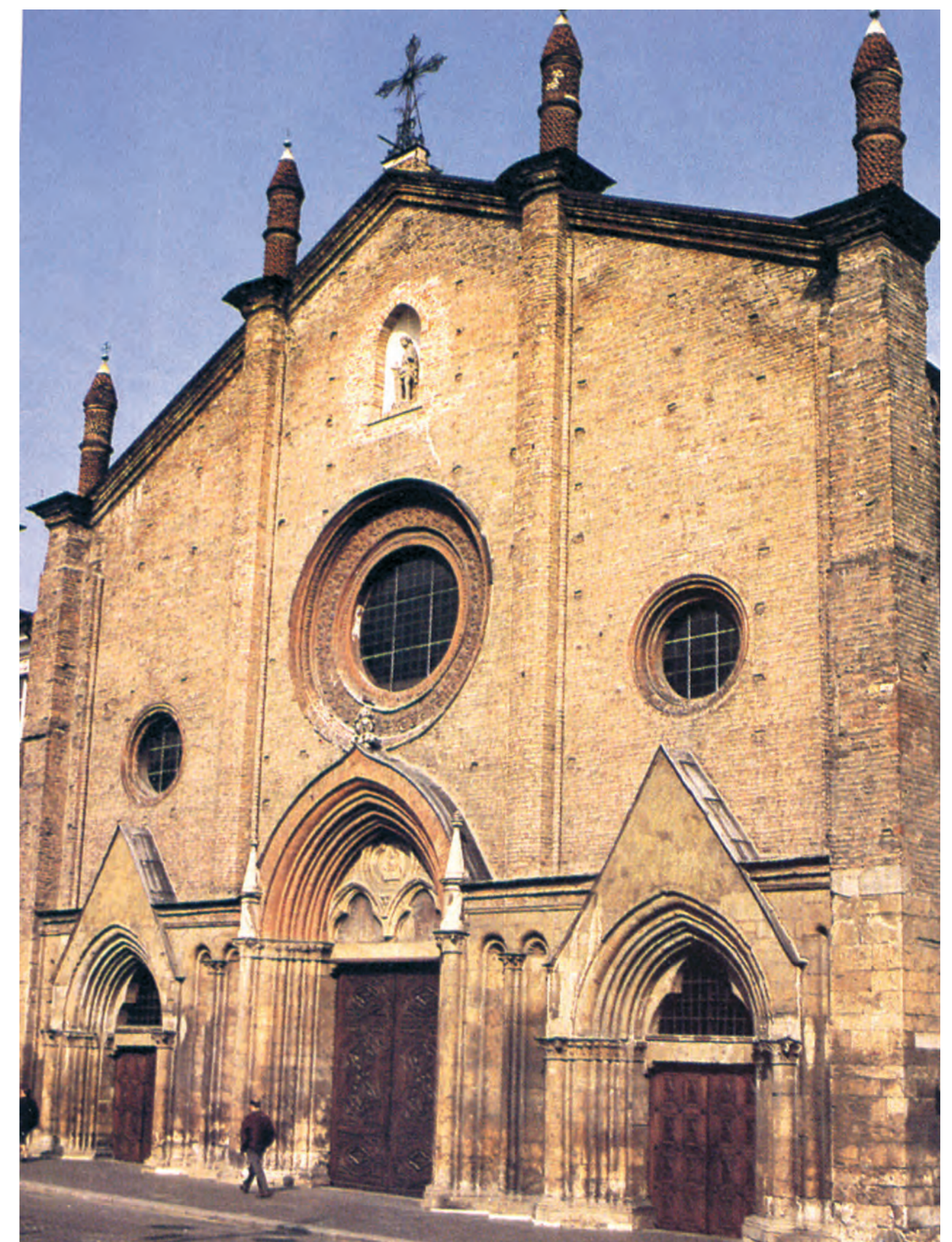
Šv. Sekundo bažnyčia Astyje