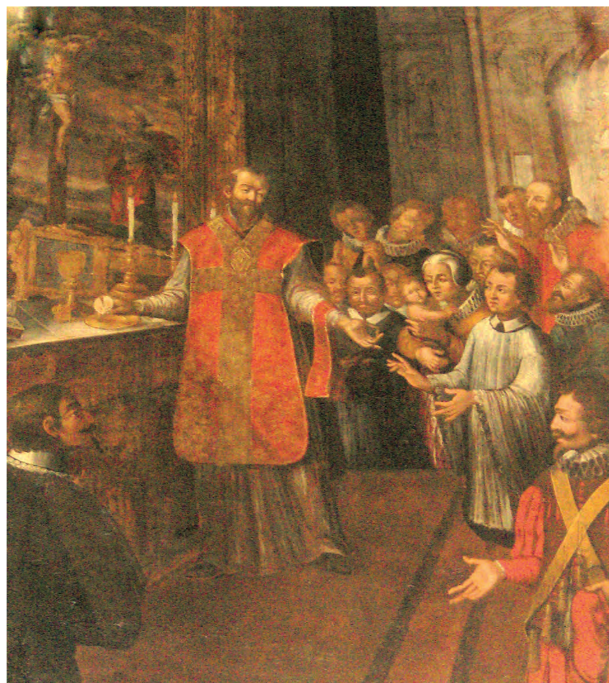
Nežinomo XVII a. dailiniko paveikslas (aliejus, drobė), vaizduojąs Eucharistijos stebuklą, įvykusį šv. Sekundo bažnyčioje 1535 metais. Paveikslas kabo stebuklui dedikuotoje koplyčioje