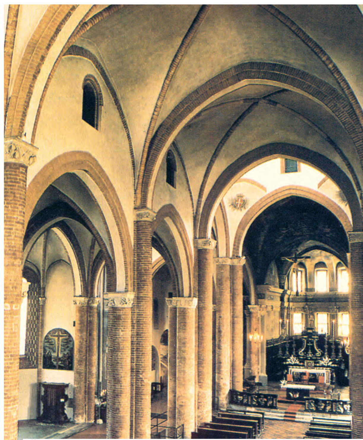
Šv. Sekundo bažnyčios interjeras